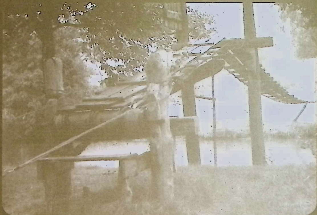
«Dinglo» over Dønhaugshølen.