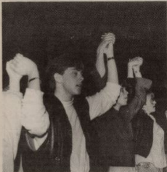
Kristent felleskap og lovspring i teltet under ungdomstreffet seint laurdag kveld, eit treff som tydeleg prova at også ungdomen er med.