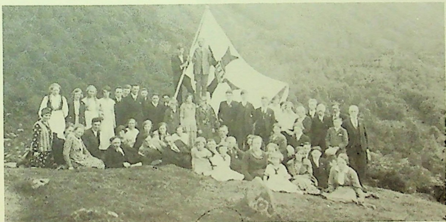
Losje «Melderskin» og Losje «Uskedølen» på tur.