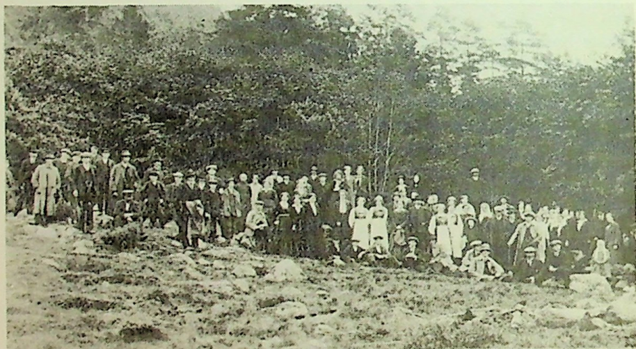
Rosendal og Lyngstrand fråhaldslag på tur til Enesdalen 22. aug. 1915.

Om sumaren vart det skipa til utflukt eller ei stemna. Sumaren 1901 gjekk turen til Øyeveten. Andre utferdsstader var: Kalven, Muradalen, Guddalsdalen, Bjørndal, Hatlestrand og Enesdalen. Turen til Enesdalen sumaren 1915 var saman med Lyngstrand og eit par andre fråhaldslag. Frammøtet var stort. Omkring 70 menneske var med på turen.