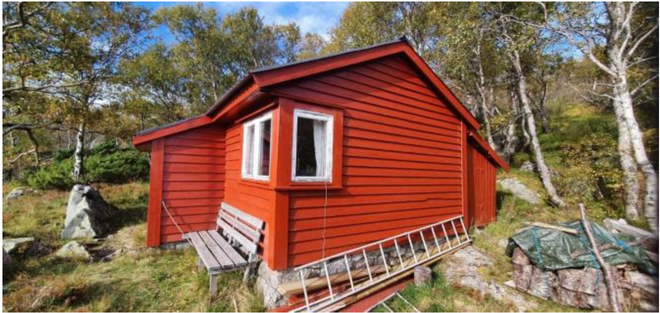
Hytta til Koltveit ved Mannsvatnet er ei av mange hytter Tor teikna.