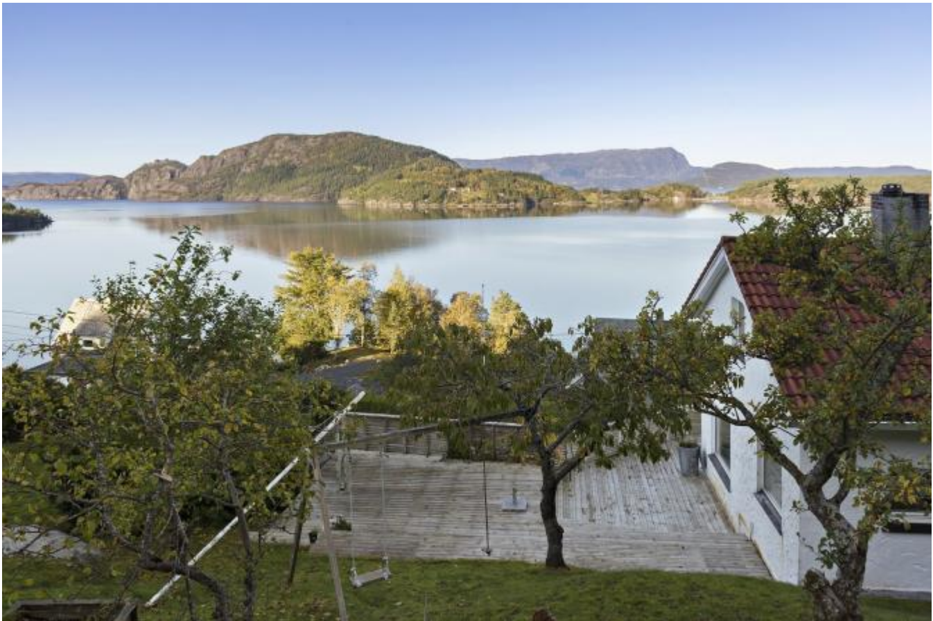
Huset på Kleivo ligg vakkert til med panoramautsikt mot Skorpo, Storsund og Hardangerfjoden.