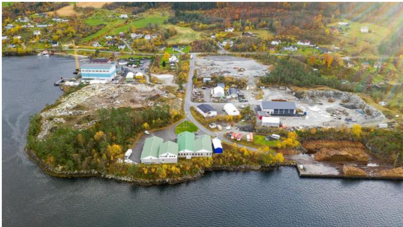
Oppdatert bilde som viser Børnes Næringsområde i dag.