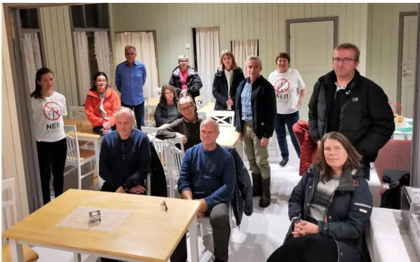
Frammøte kunne vore betre, men dei som var der, synte stor interesse med gode spørsmål og innlegg.

Vindkraftutbygging fører til store verditap av eigendom. Hus og eigedom til 4 mill. kr. i nærleiken av vindturbinar i Tysvær hadde eit verditap på 2 mill. kr. Utbyggjar tek pant i eigendomen. Utdrag frå Grunnboka syner at gardsbruk er pantsett der det i dag pågår større utbyggingar. Dette er berre noko av det som kom fram på ope møte i Uskedalen i går kveld. Det var dårleg frammøte frå dei som eigenleg var målgruppa, nemleg grunneigarar, hytteeigarar, grunneigar- og utmarkslag, hjortejegerar og andre med interesse i friluftsliv. Det var likevel eit godt og konstruktivt møte med mange spørsmål og innlegg frå salen.