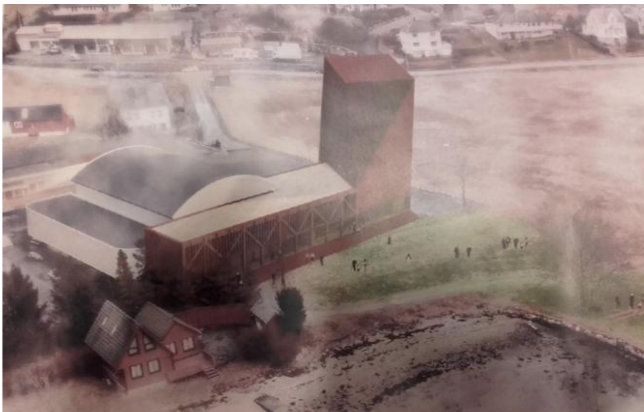
Skissen med dårleg biletkvalitet syner bygningsmassen mot sjøen.

Det er varsla oppstart av arbeidet med reguleringsplan for eit utvida aktivitetshus med klatrehall. Uskedal Idrettslag ved Klatregruppa inviterte til eit to timars informasjonsmøte, organisert som som stand, i går. Alt kl. 19.00 var naboar og andre interesserte møtte fram for å få vita meir om innhaldet og prosessen. Det er rekna fire steg i sjølve prosjekteringa. Fase ein er reguleringsplan.