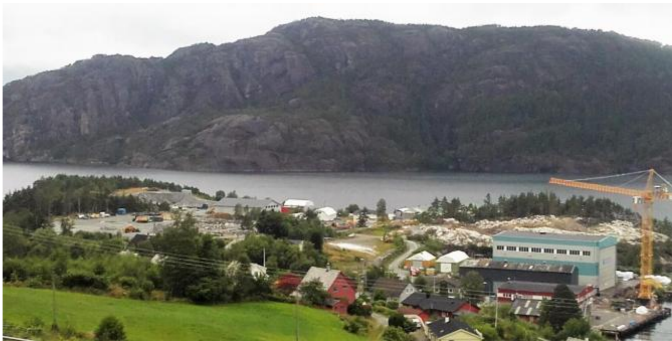
Børnes Næringsområde slik det ser ut i dag, fotografert fra Steinsletto.

Med bakgrunn i vedtak 9. juni vart Detaljregulering for Børnes Næringsområde lagt ut til høyring og offentlig ettersyn. Fristen for å koma med merknader til planen er måndag 7. september. Gjeldande reguleringsplan for Børnes vert med dette oppheva. Kvinnherad kommune eig planen. Konsulenten har vore ABO PLAN & ARKITEKTUR på Stord.