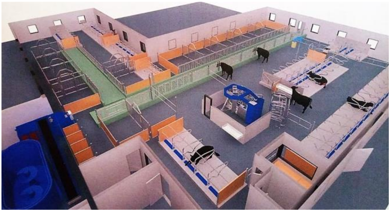
3D skisse som syner innredning og interiør.