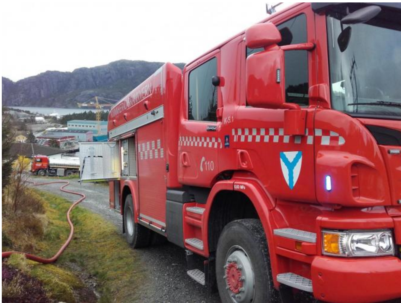
Kjapp responstid er ofte avgjerande for utfallet av ein brann.