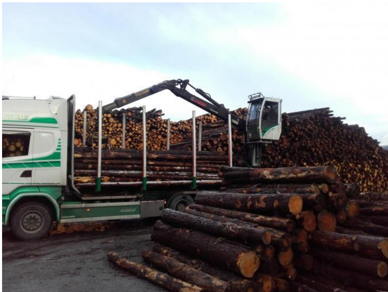
Årleg uttak av tømmer frå Børneset er på 25 - 30 000 km.