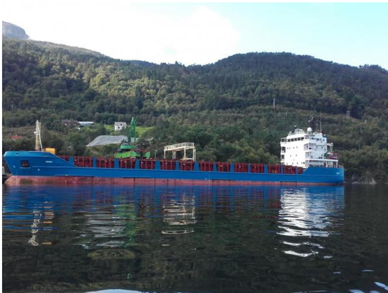
Børneskaien kan bli opprusta for knappe 10 mill. kr. MS GRINNA ( 6419 tdw, 115,5 meter ) er mellom dei største skipa som brukar Børneskaien fast til tømmerutskipping.