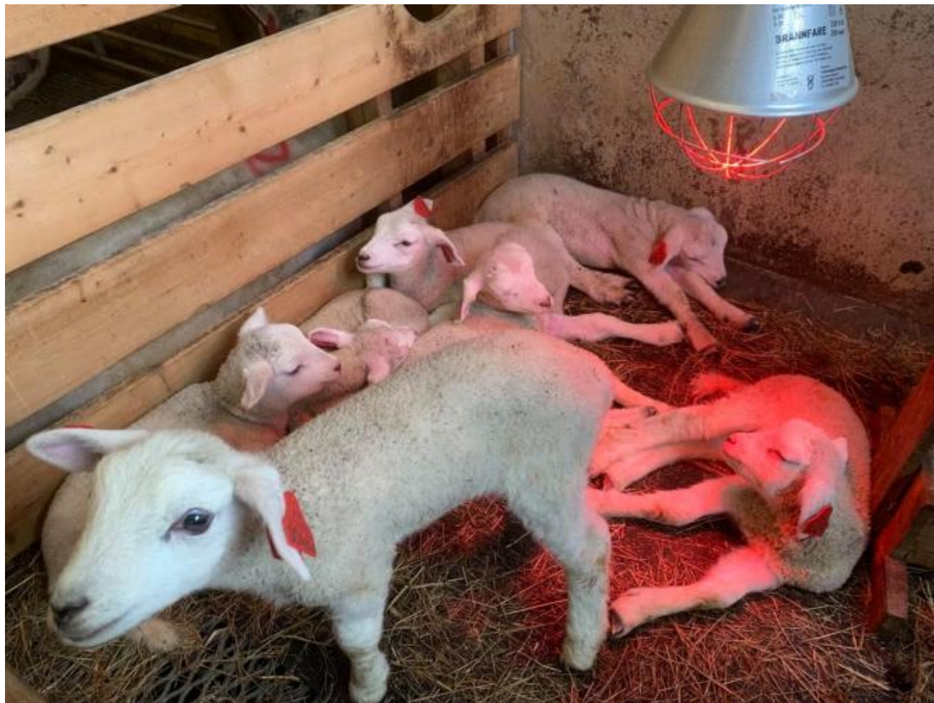
Lembinga høyrer ofte påsken til for mange i bondestanden.