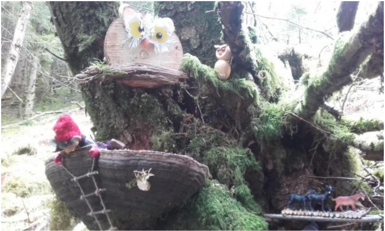
Trollrota i Kleivadalen fekk stor merksemd.