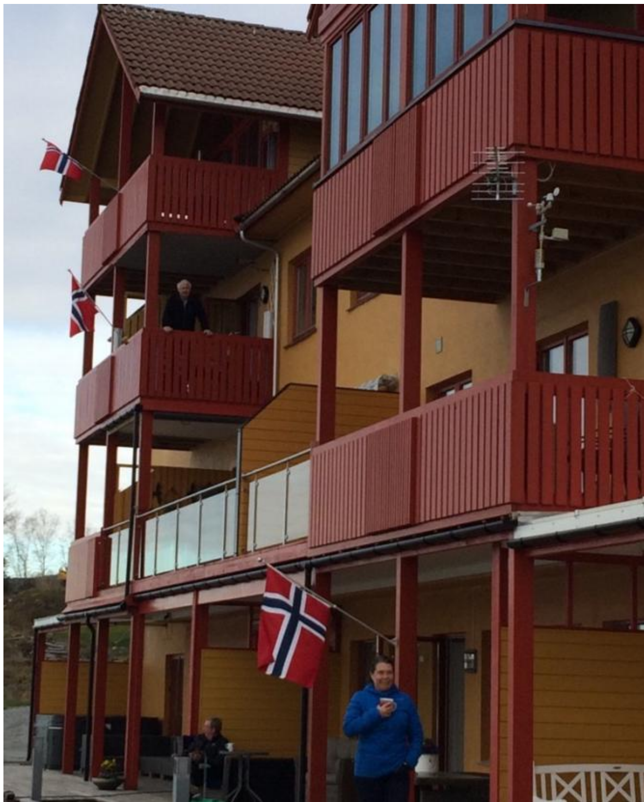
Med flagg og klapping vart påsken markert i Beinavikjo i kveld, langfredag.

I disse koronatider er kreativiteten stor for å skapa trivsel og tru på at snart er smittefaren over. Med inspirasjon frå Italia vart det kl. 19.00 gjennomført ein minikonsert på kaien på Uskedalen Brygge med tilrop og klapping frå bebuarane på altanane. Musikken var vald ut i solidaritet med Italia, landet i Europa med flest omkomne i pandemien.