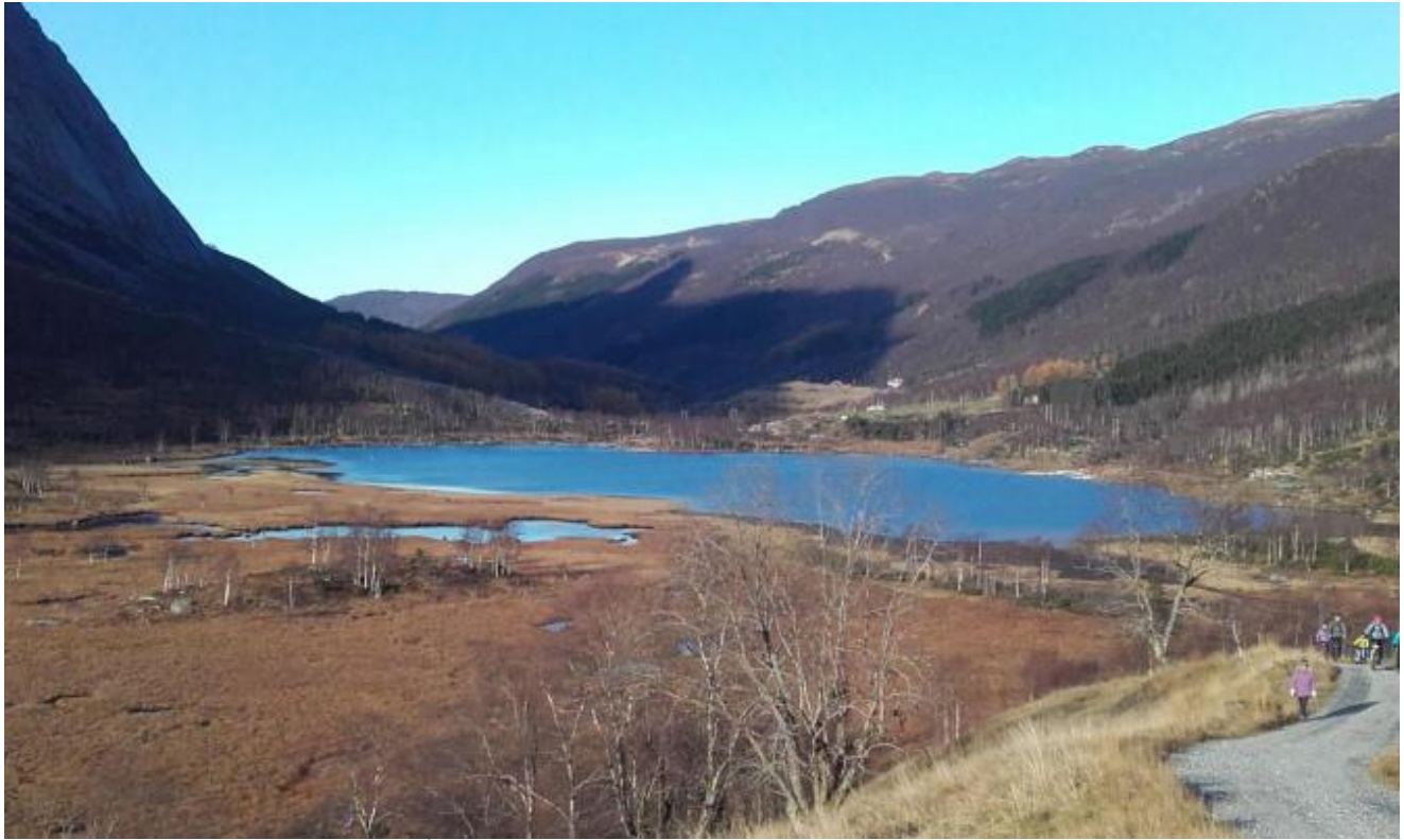
Fjellandsbø med Åsaredalen har lett tilkomst og vil vera ein god plass for ei dagsturhytte.