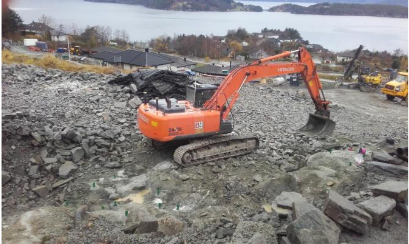
Nabotmta er utskoten og planert. Betongarbeidet startar i denne veka.