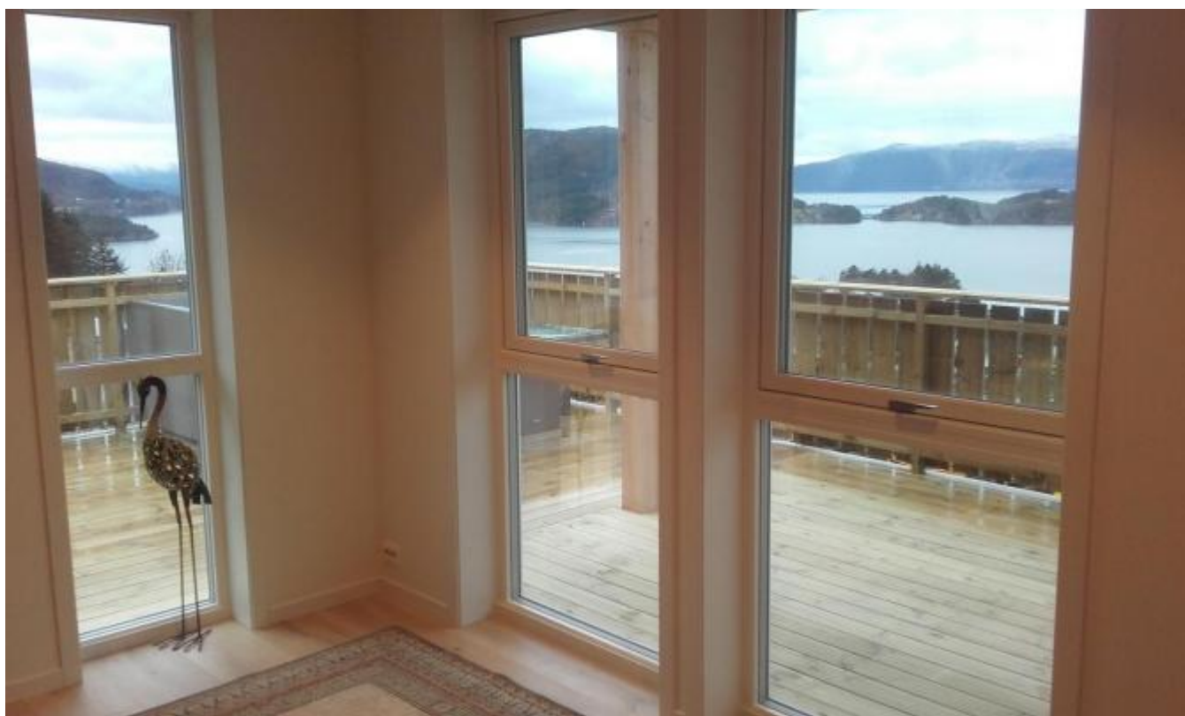
Bustadene, som no vert innflytta, går over to plan, har god planløsning og ein framifrå utsikt mot Skorpo og Storsund.

Det er også planlagt ein større bustad på eit plan på tomta som grensar til plassen der Kirsten og Kåre K. Rød bur. Vidare vert alt det formelle med søknader gjort klart for tre einebustader plassert innerst mot Rød og og ytterst mot Uskedalen. Går alt etter planen, kan det bli byggestart i 2020.