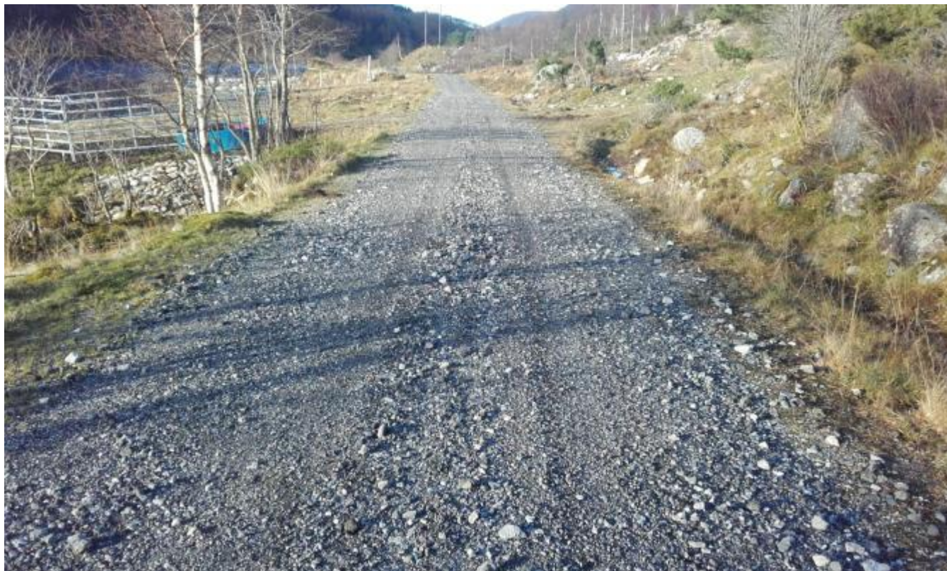
Vegen mellom Friheim og Fjellandsbø er grusa og avretta. Grøftene er reinska.

Det har lenge vore tvil om Kvinnherad kommune sitt ansvar for tilsyn og vedlikehald på vegen frå Friheim til Fjellandsbø. No er den 1,8 km lange traseen avretta og grusa. Grøftene på begge sider er reinska. Massane er mellom anna frest oljegrus frå arbeidet med Opsongersvegen på Husnes.