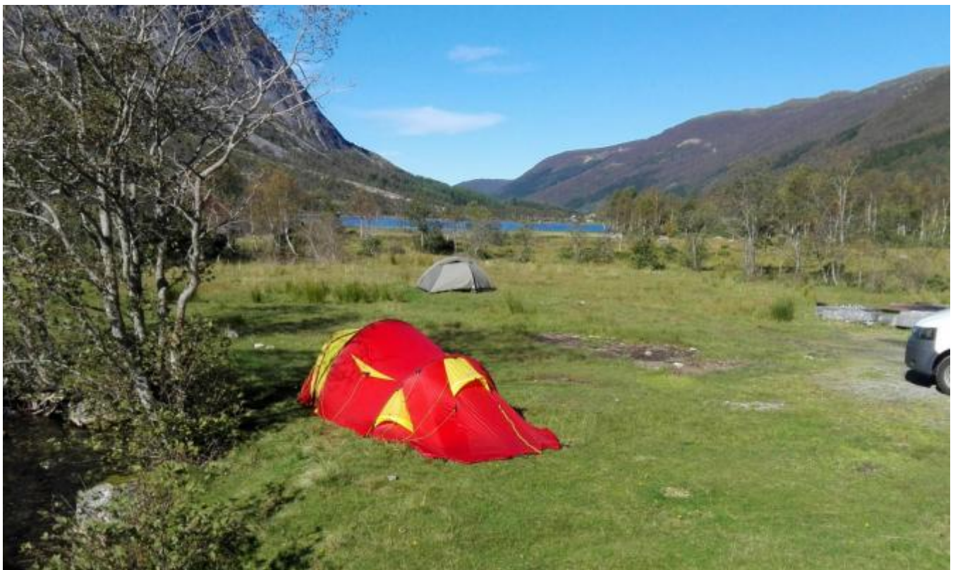
Det var framleis 2 telt ved Fjellandsbøvatnet utpå søndagen. Truleg var det fleire tidlegare i helga.

Det har vore ein nydeleg sundag, og alle bilane som har stått parkert ulike stader opp gjennom dalen, tyder på at mange har brukt dagen til ein tur ut i den vakre naturen vår. Ein turgåar som ofte går Pålavegen, kunne fortelja at han trudde at han aldri hadde møtt så mange på denne populære veggen opp til Hauglandsfjellet og Mannsvatnet.