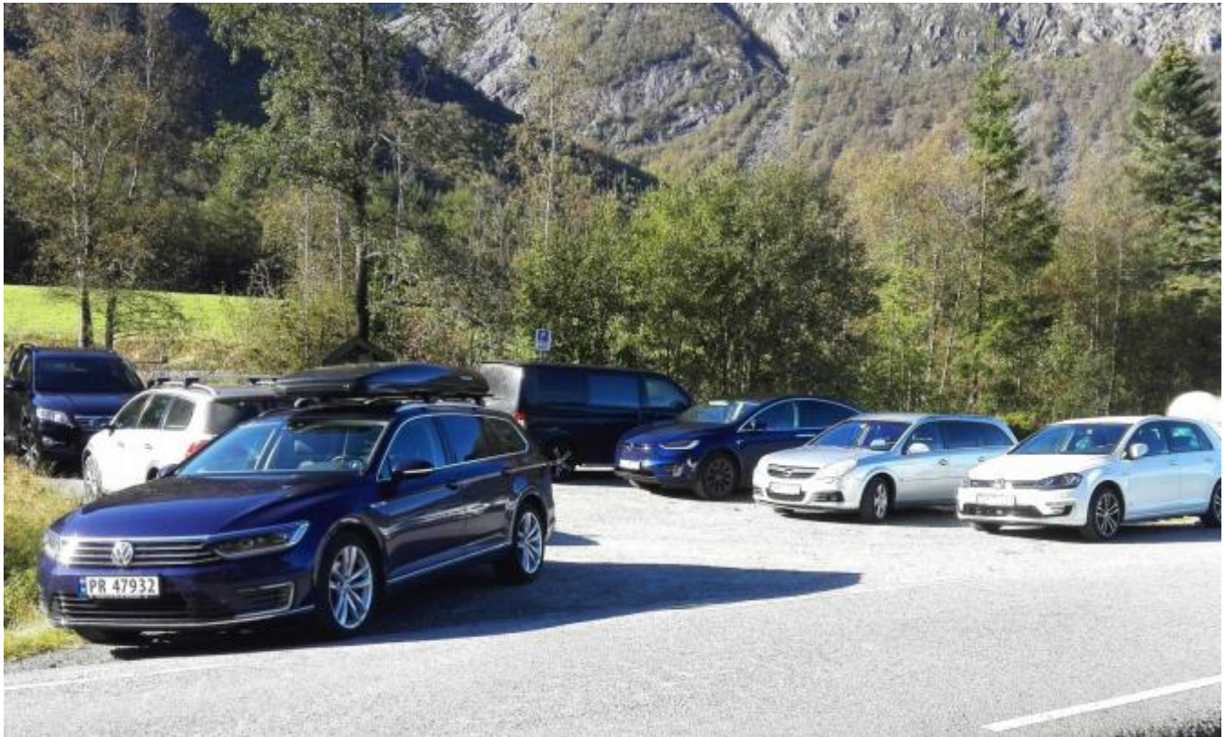
Stappfullt med bil ved startpunktet til Ulvanåso og kalkestasjonen.

Det har vore ein nydeleg sundag, og alle bilane som har stått parkert ulike stader opp gjennom dalen, tyder på at mange har brukt dagen til ein tur ut i den vakre naturen vår. Ein turgåar som ofte går Pålavegen, kunne fortelja at han trudde at han aldri hadde møtt så mange på denne populære veggen opp til Hauglandsfjellet og Mannsvatnet.