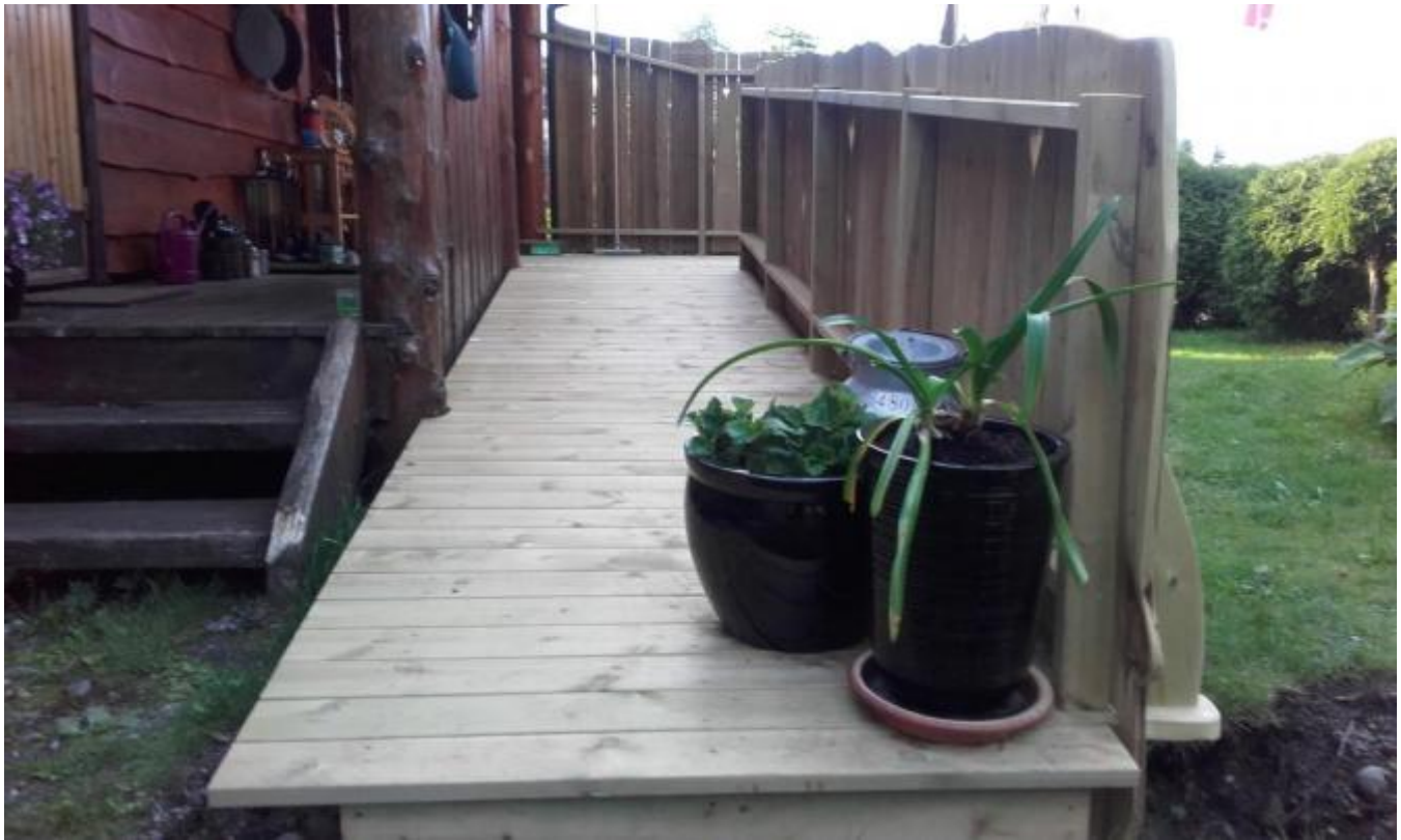
Sjølve rullestolsrampen er funksjonell og fint tilpassa resten av installasjonen.