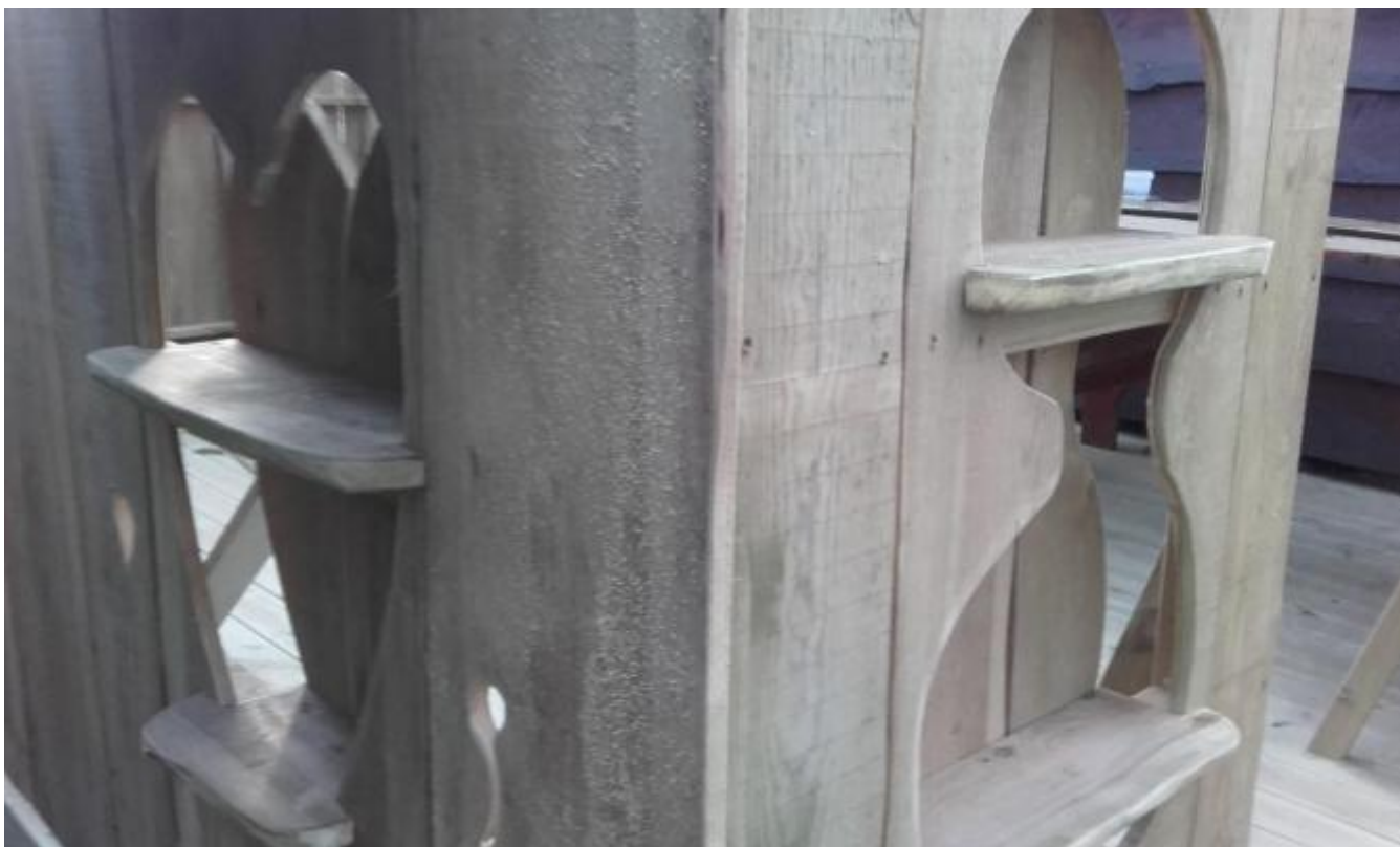
Eit hjørne på terrassen er utforma som ei nisje med hyller.