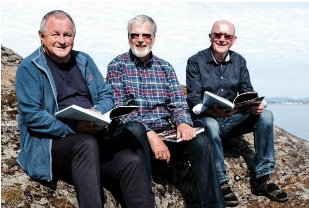
Boknemnda gler seg over eit godt resultat.

Det går godt an å tenkja på julepresangar allereie no, legg utgjevaren til.