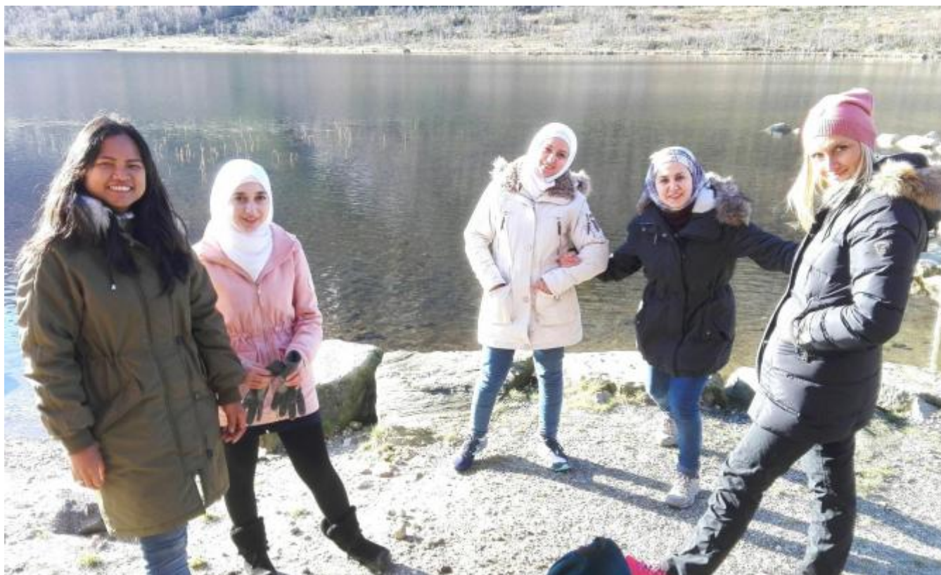
Flott gjeng ved Fjellandsbøvatnet.