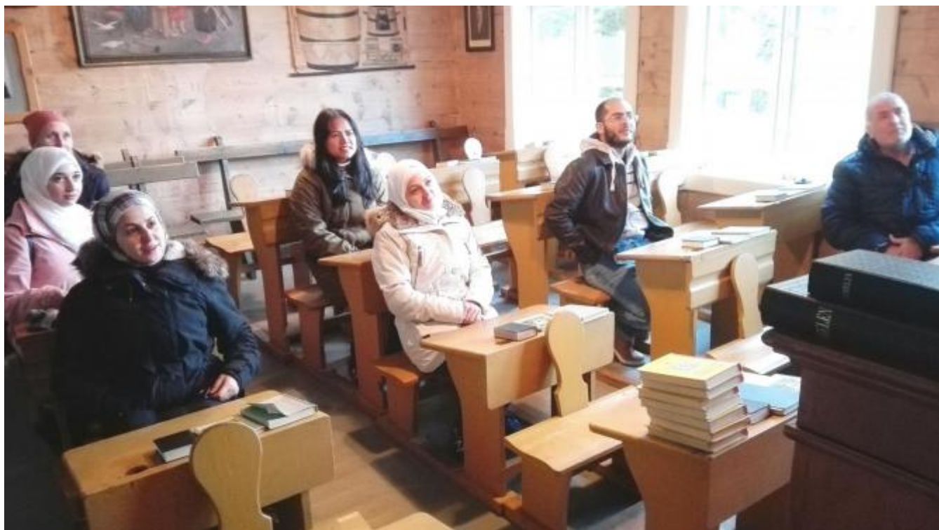
Gammaldags skuledag i gammalt miljø. Svært interessant!

Dei var mildt sagt kjempefornøgde dei 6 elevane frå Eining for integrering og opplæring som tilbrakte skuledagen fredag i Uskedalen. På programmet stod besøk på skulemuséet på Haugland og på Fjellandsbø. Dagen vart toppa med det aldeles nydelege haustveret som endeleg dukka opp.