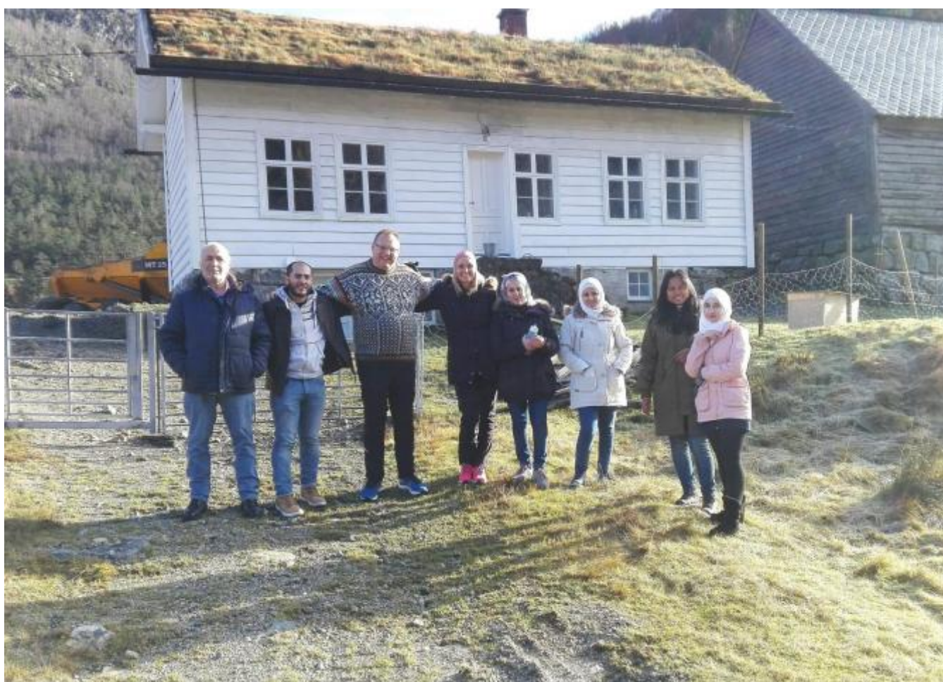
Ein svært fornøgd gjeng ved Fjellandsbøgardane.