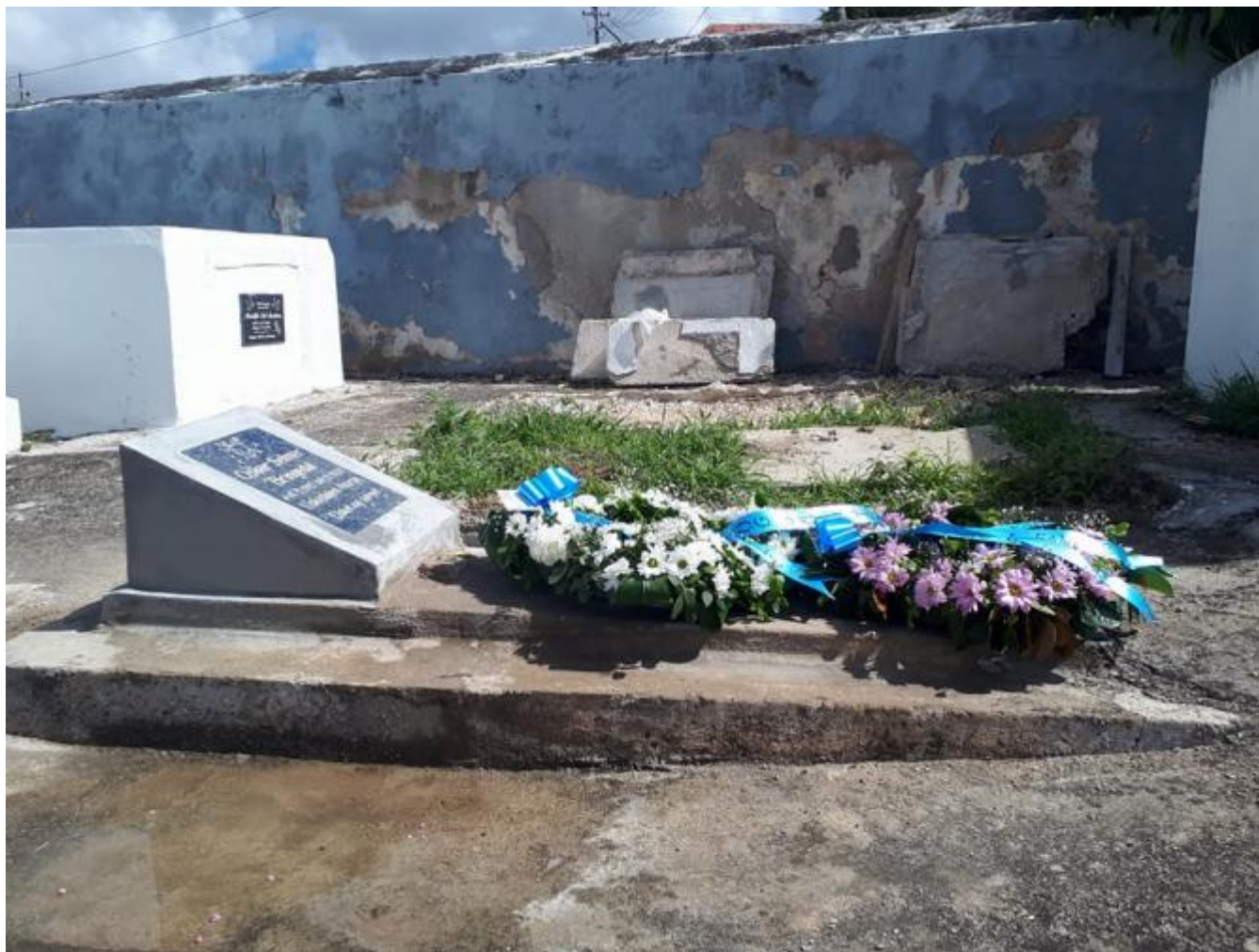
Oskar Bringedal si sjømannsgrav på Curacao er i dag restaurert og teken vare på for framtida.