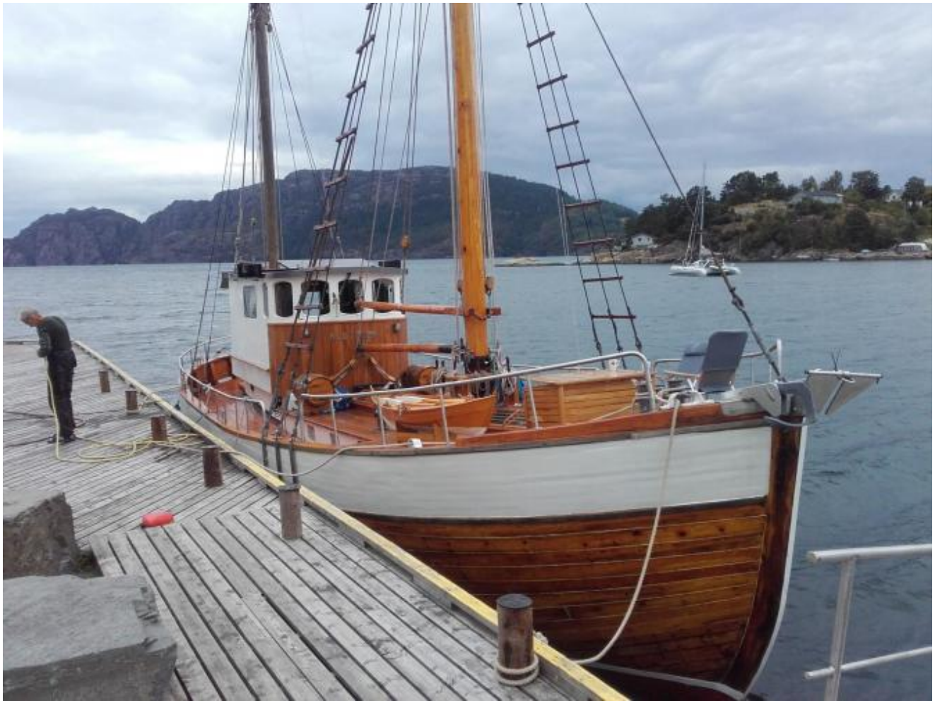
NJØTHOLM er i dag eit lystfarty i strøken stand, med ny master og rigg.