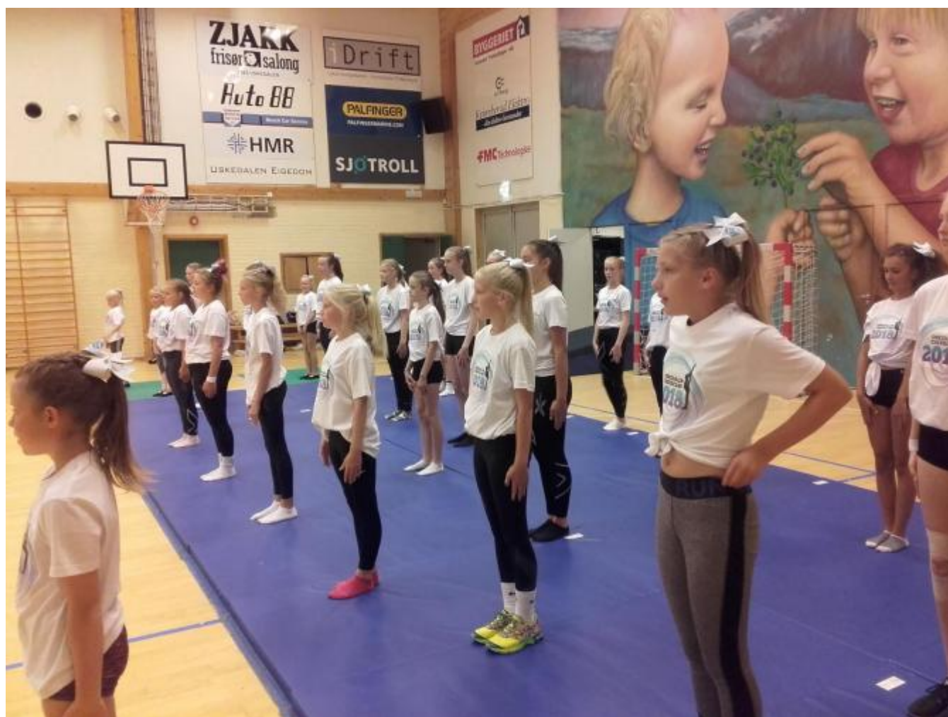
60 born og ungdomar i alderen 5 til 17 år har vore med på cheerleading i helga.

60 born og ungdomar i alderen 5 til 17 år er i helga samla i Uskedalen til cheercamp i Aktivitetshuset. Arrangøren er to grupper for cheerleadingmiljøet i Begen, Åsane Seahawks og BTSI Bergen. Cheerleading er ein krevjande idrett der alle må vera disiplinerte og stola på kvarandre. Kurset i Uskedalen vert avslutta med open framsyning tysdag kl. 18.