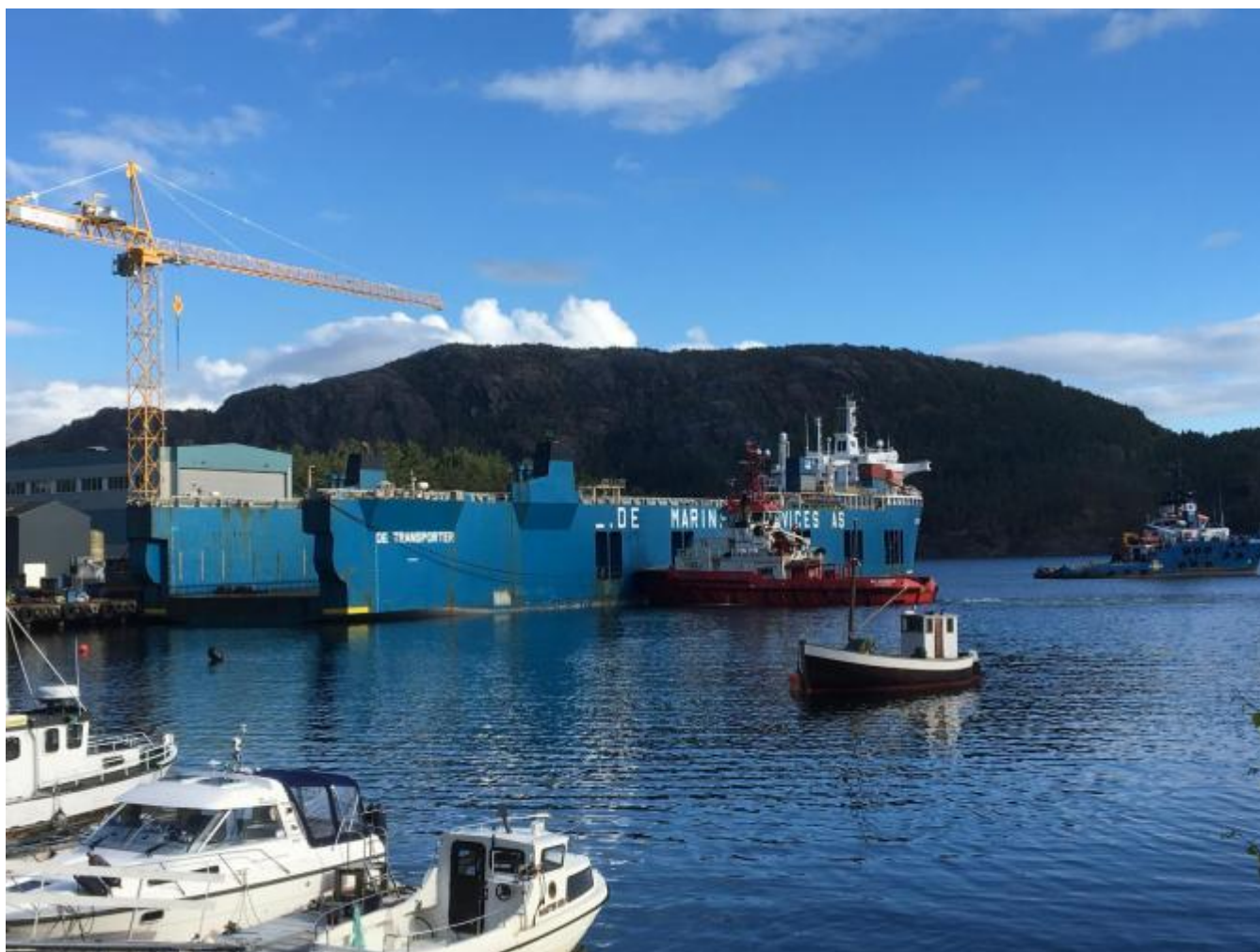
Det 190 meter lange tungløfteskipet er klar for slep til Tyrkia.

I dag tidleg klokka 08.30 løyste DE TRANSPORTER alle fortøyningane og glei fint frå kaien på Eidsvik Eigedom sitt anlegg på Børneset. Med to slepebåtar gjekk turen på nord gjennom Storsund, rundt Kalven og ut Hardangerfjorden. I skrivande stund går slepet med 5- 6 knop og posisjonen er vest for Karmøy. Skipet er seld til skipsverftet Tersan Shipyard i Tyrkia og skal byggjast om og brukast som dokk. Salsprisen er 12 mill kr.