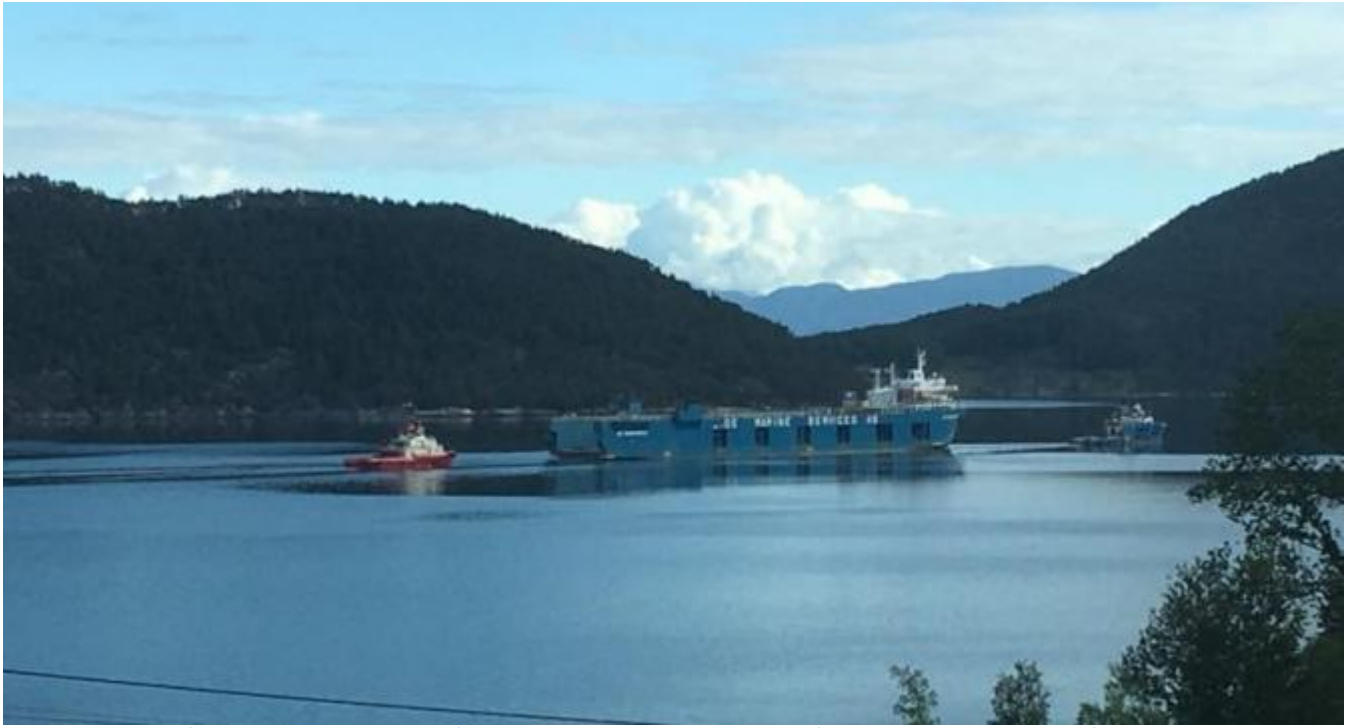
Slepet gikk ikkje gjennom Gavelen slik mange venta, men nord for Kalven og ut i Hardangerfjorden.