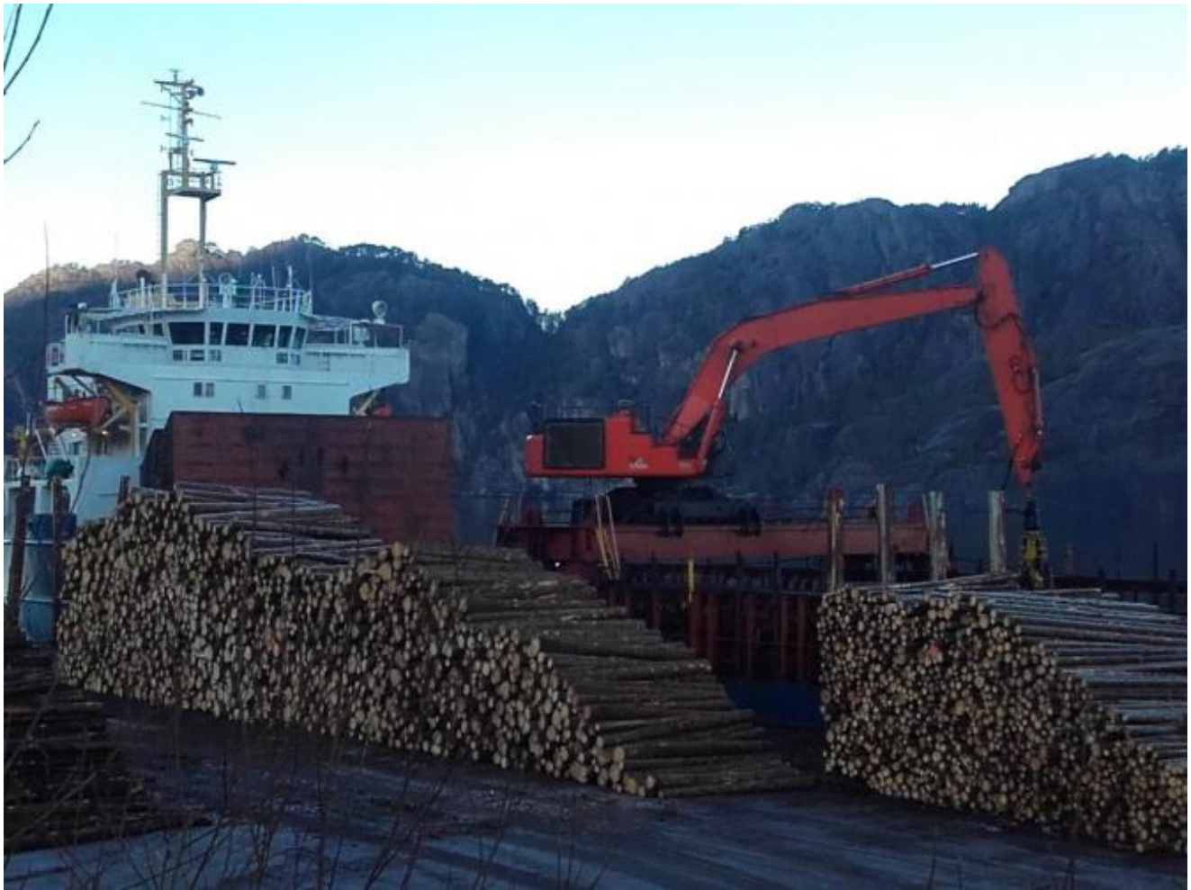
MS HEIDI lastar tømmer for avgang til Danmark i kveld.