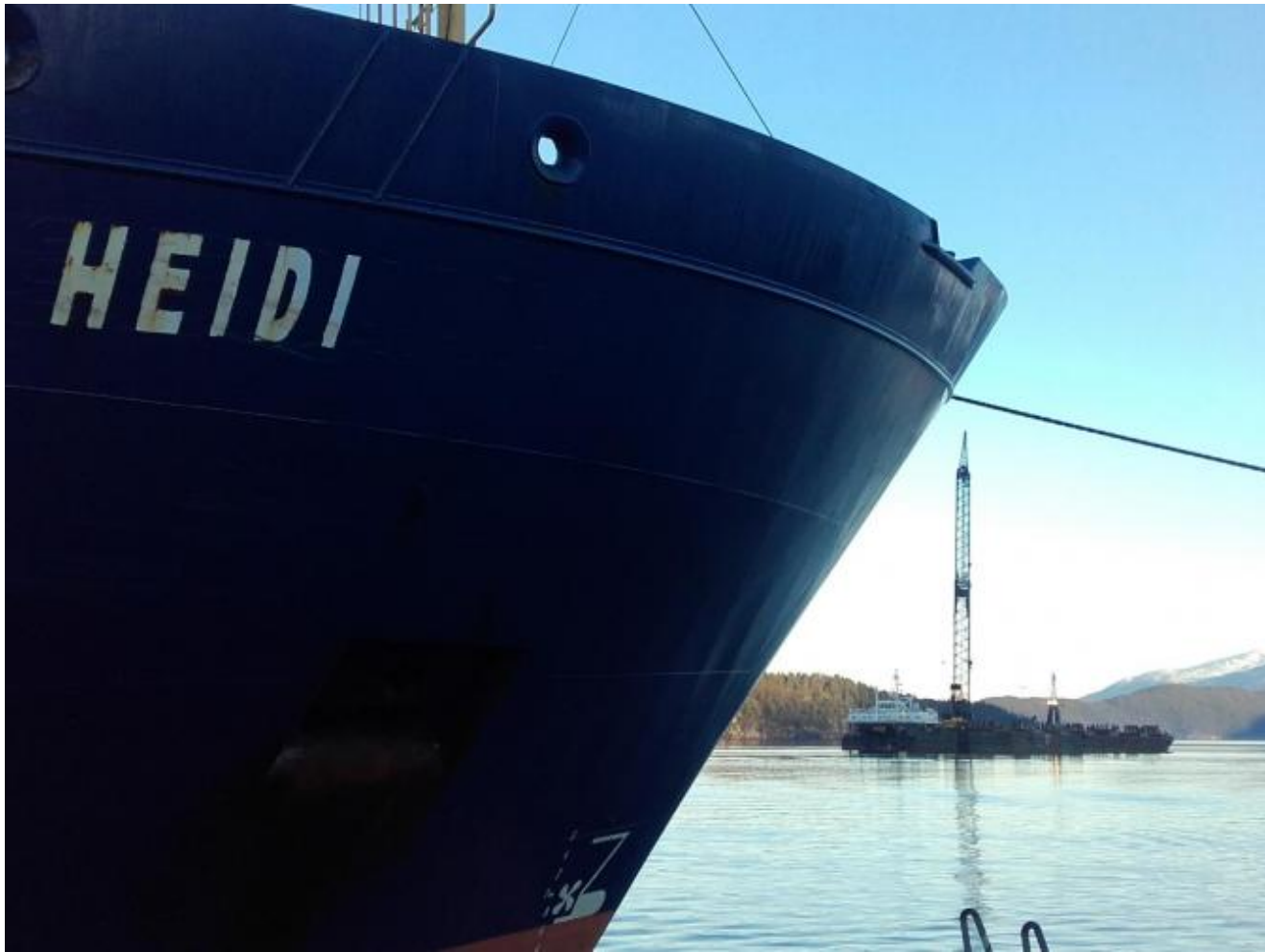
Det var kø for å koma til kai på Børneskaien i dag.

Det var stor aktivitet på Børneskaien i dag. MS HEIDI last tømmer. Flytekranen EIDELIFT 6 måtte forhala og la seg til i Storsund i påvente om å få koma til kai i ettermiddag. Flytekranen med slepebåt kom til Børnes frå indre Kvinnherad i natt i 03 tida. Uskedalen.no kjenner ikkje kva oppdrag Eideliften har i Uskedalen, men kaien vert ofte brukt i den tida kranskip gjer større løft for skipsindustrien.