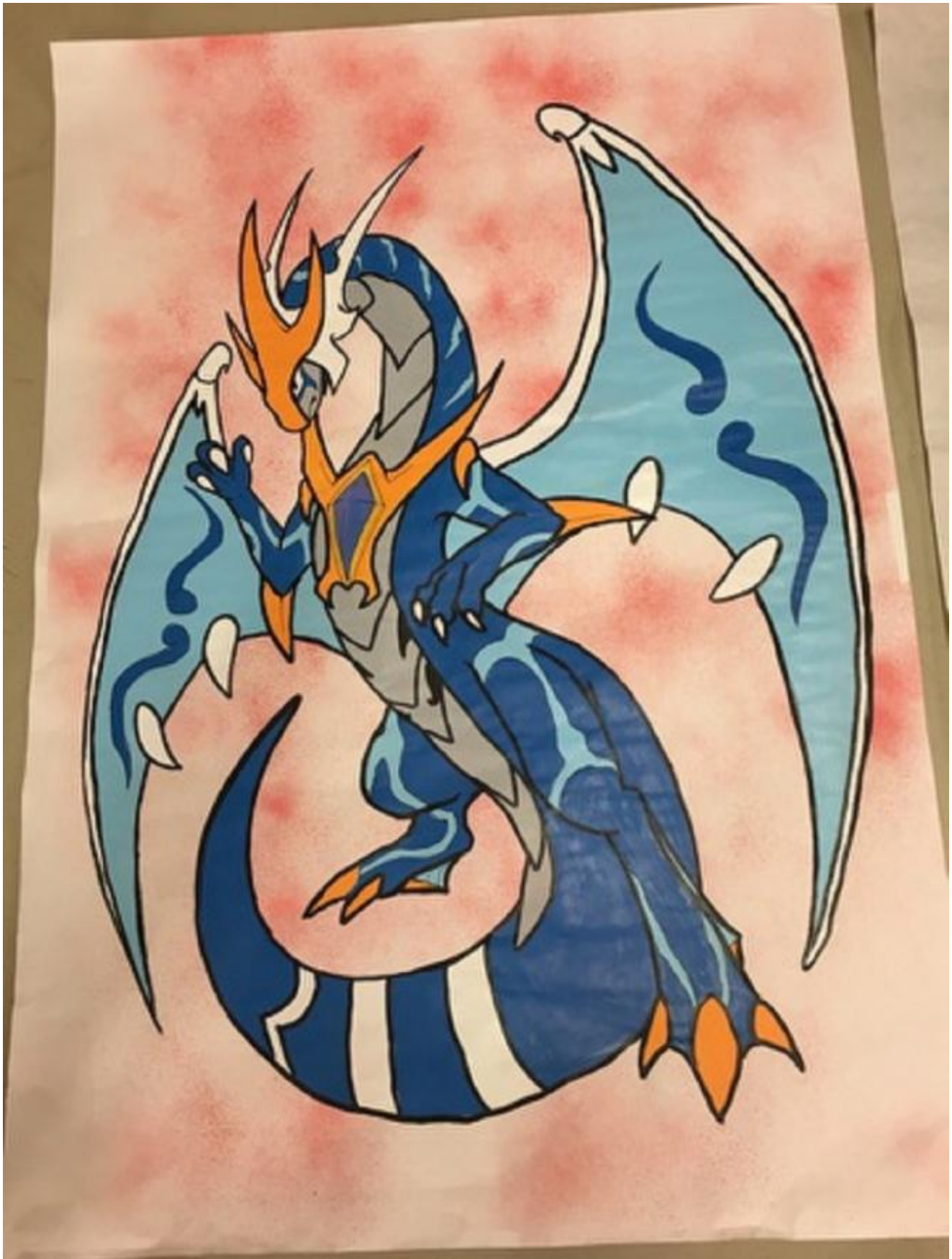
Tre kunstplakatar var sett opp utanfor Spar på søndag.