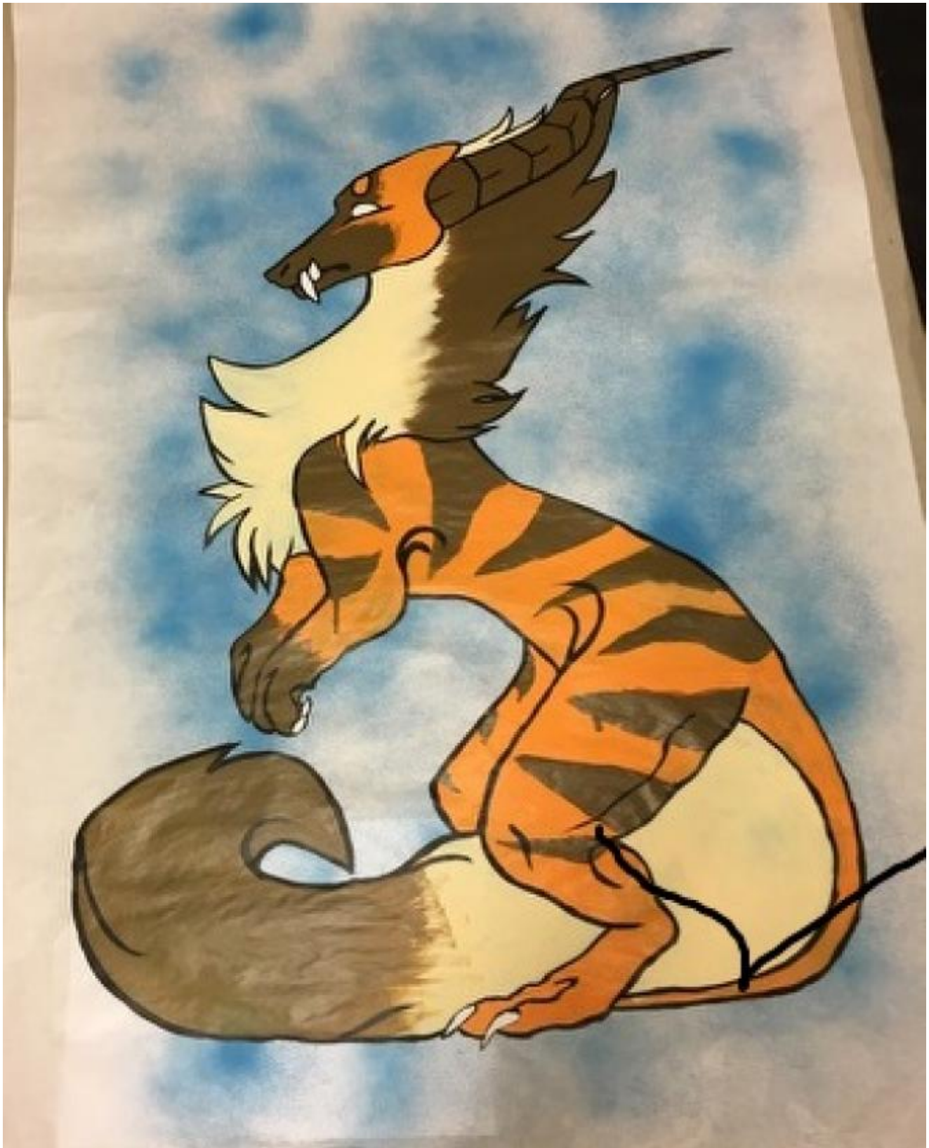
Tekst og nett: Thor Inge Døssland