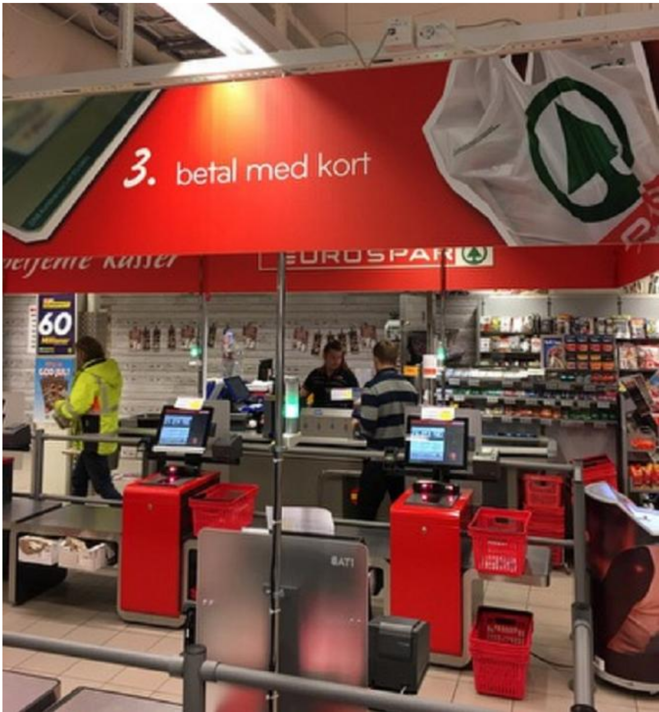
Slik vil dei nye kassane sjå ut.

Spar Uskedalen har stadig utvida og utvikla seg. Sjølv om butikken er aller best kjend for sin gode service, har også dette vore medverkande til at butikken heile tida er i fremste rekkje av Spar-butikkane i landet. No er det klart for ei ny ombygging når butikken installerer sjølvbetjeningskassar der kundane kan scanna varene og syta for betaling sjølv.