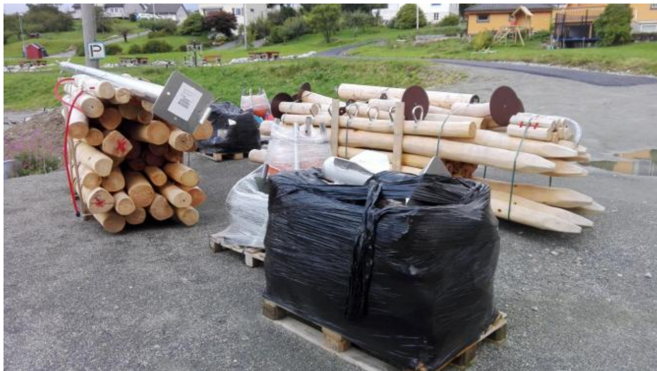
Med montør frå leverandøren og dugnadshjelp skal dette bli klatrepark.

Arbeidet med parken er alt i gang. I førre veke var Brødrene Musland på plass og retta av og drenerte området der parken skal stå.