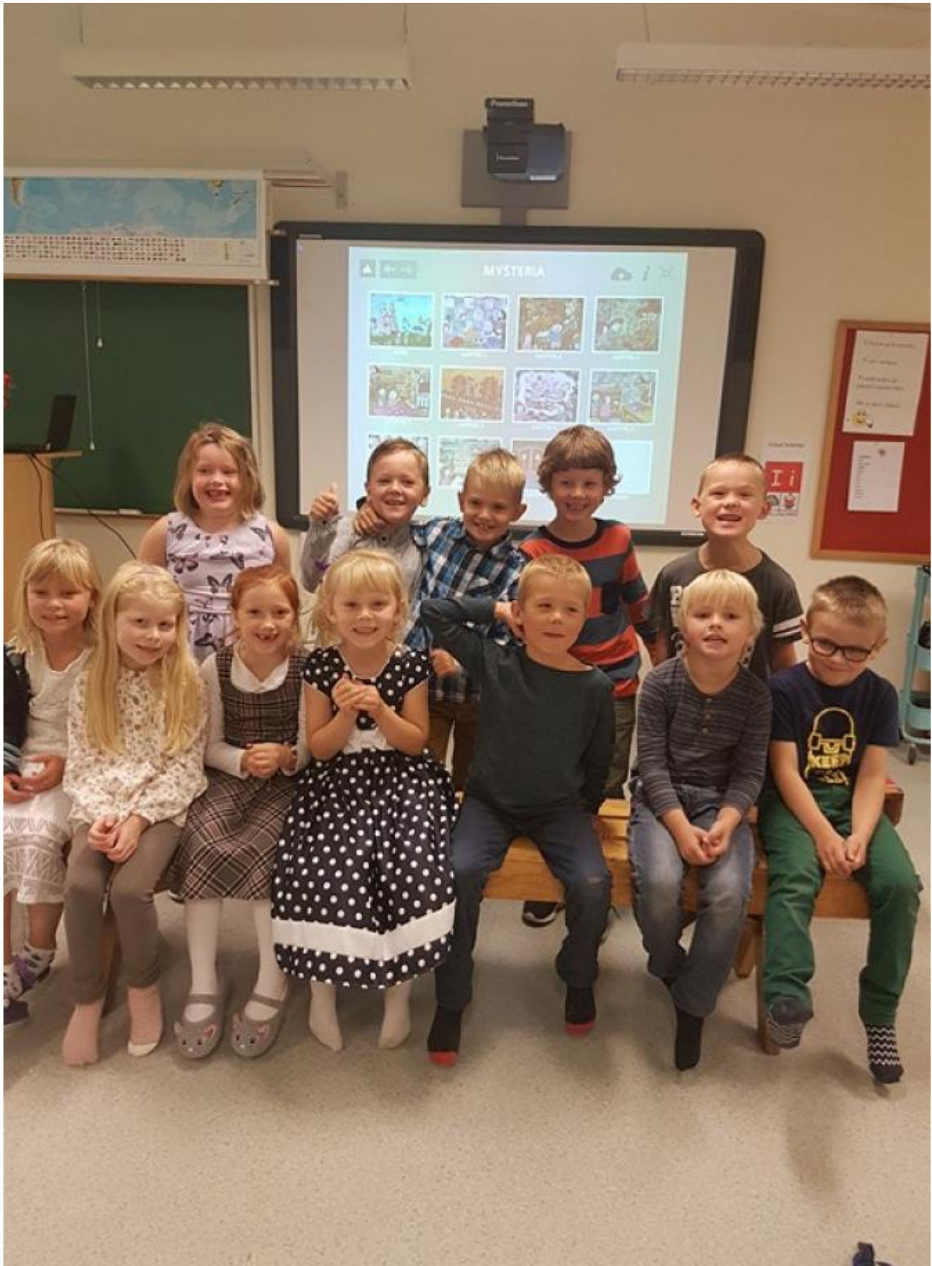
12 forventningsfulle 1. klassingar på sin fyrste skuledag.