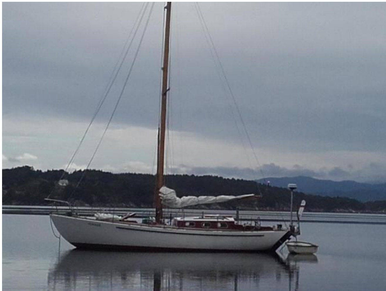
Eit tysk seglfarty på Nesjavikjo i sommar.

For nokre veker sidan la ein tysk seglbåt seg til på Nesjavikjo, vikjo nord i Holmsund. Nesjavikjo er ikkje ein ankringsplass på draftet. Det er heller ikkje Stølavikjo, slik det har vore i alle år. Grunnen er truleg nedsenka avløps- og overvassledningar frå pumpestasjonen ved Uskedal skule til Børnes reinsestasjon.