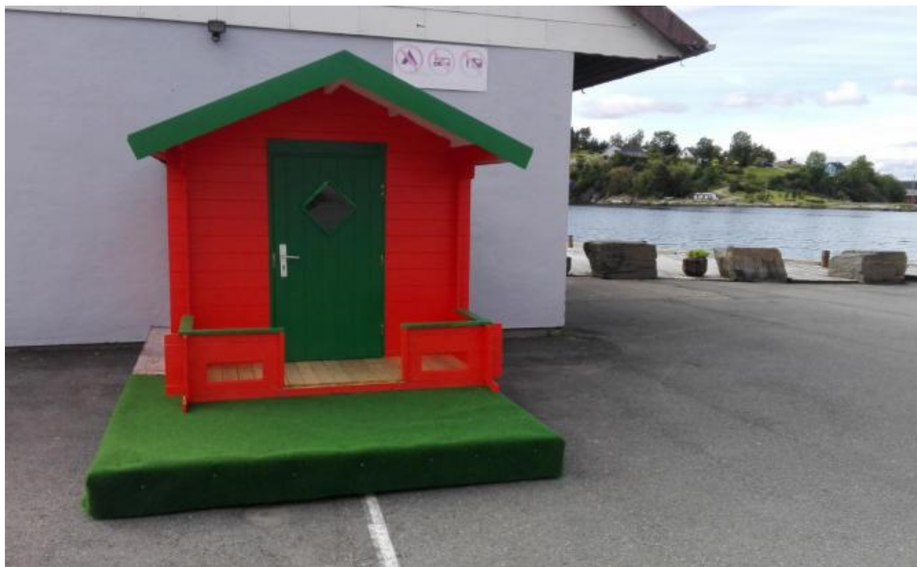
Det nye mini-biblioteket på Sandakaien.

Det aukar stadig på med nye aktivitetar og tilbod på Sandakaien. For ikkje lenge sidan vart det opna petanquebane og utesjakk der, og no er det jammen kome eit mini-bibliotek. Alt er til gratis bruk for både fastbuande og tilreisande. Dette er kjempegode tilbod som eigarane Spar Uskedalen ønskjer både skal bli brukt, og bli tatt godt vare på.