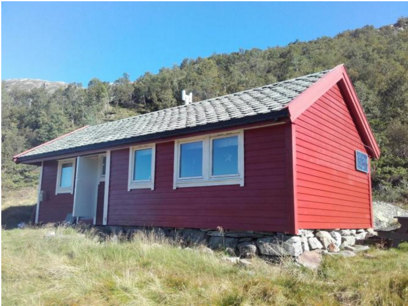
Lagshytta Fjelly slik vi ser henne i dag nymåla og renovert.