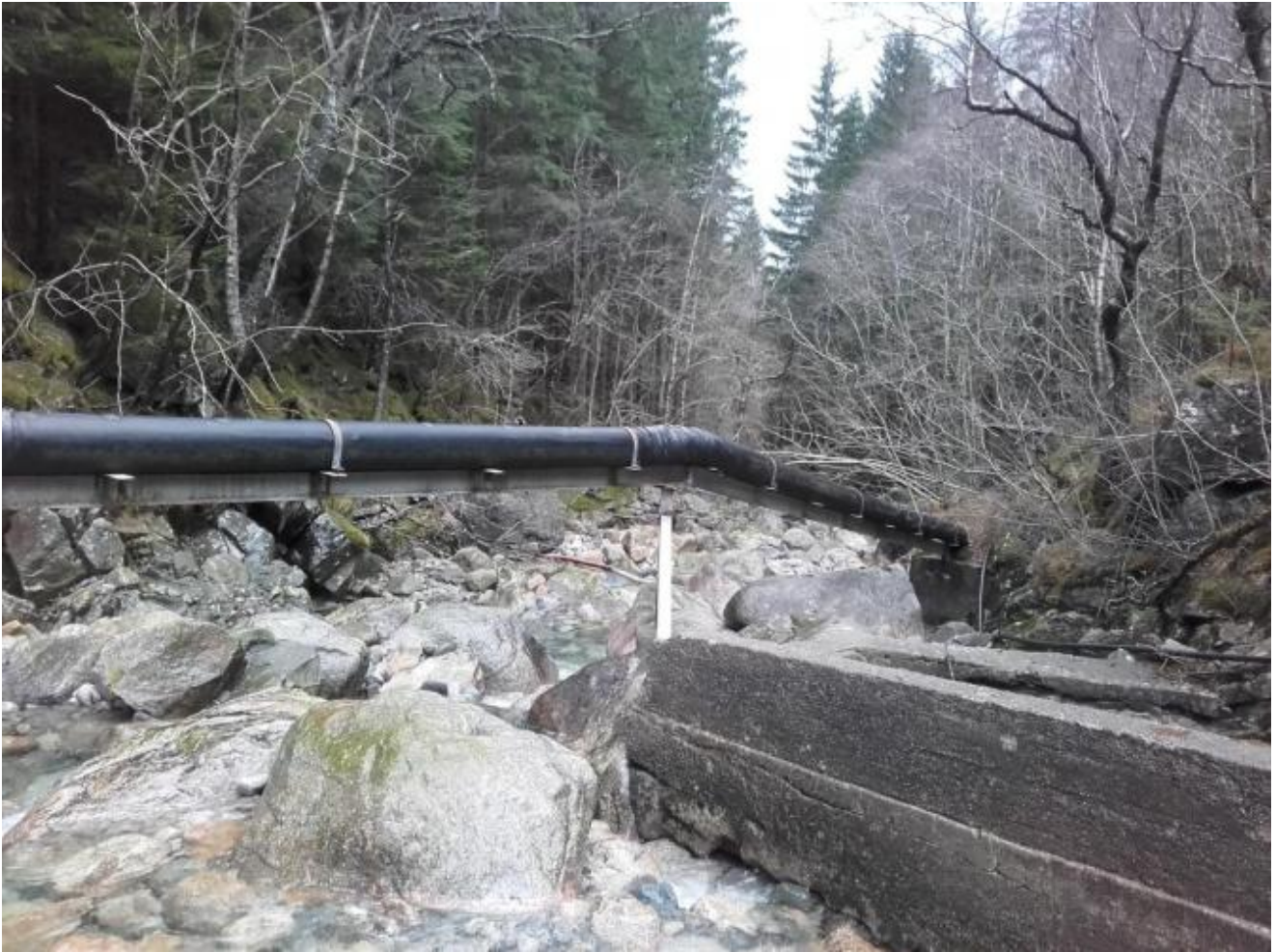
Bilete syner dimensjonen på røyret som fører vatnet inn på nettet.