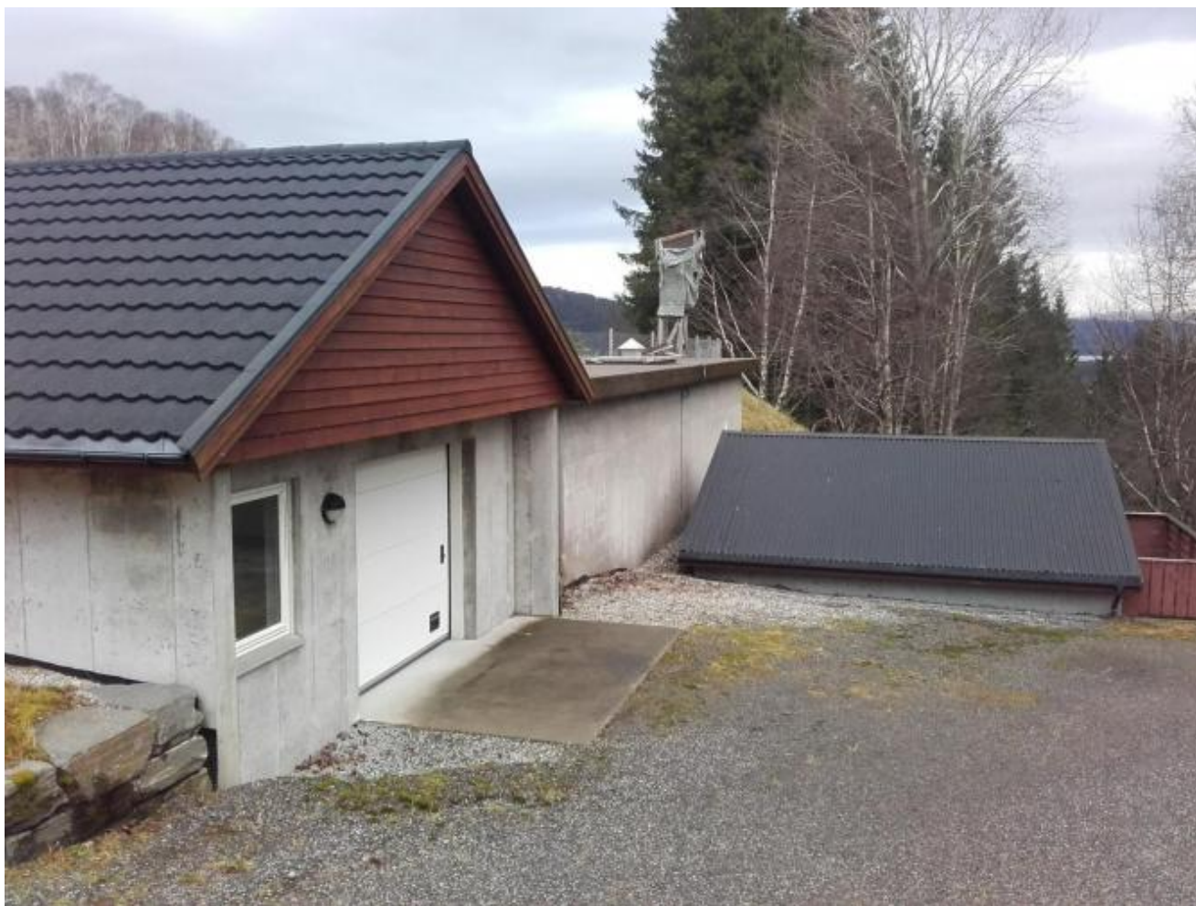
Vssverket kan syna til ei effektiv og god drift. Bilete syner vassbehandlingsanlegget på Sørestølen på Eik.

Uskedal vassverk skal ha årsmøte tirsdag 2.mai kl.19.30 i Uskedal skule. I tillegg til dei vanlege årsmøtesakene med årsmelding, rekneskap og valg, er det to saker som bør vera av stor interesse for vassverksmedlemmene. Det er status for vatn frå Tverrelva og framlegg om auke i vassavgifta.