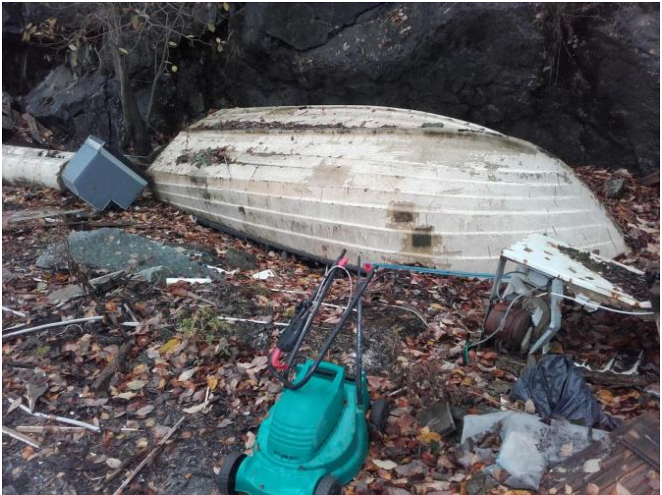
Kommunen og Skogeigarlaget må ta ansvar for rydding på Børneskaien.