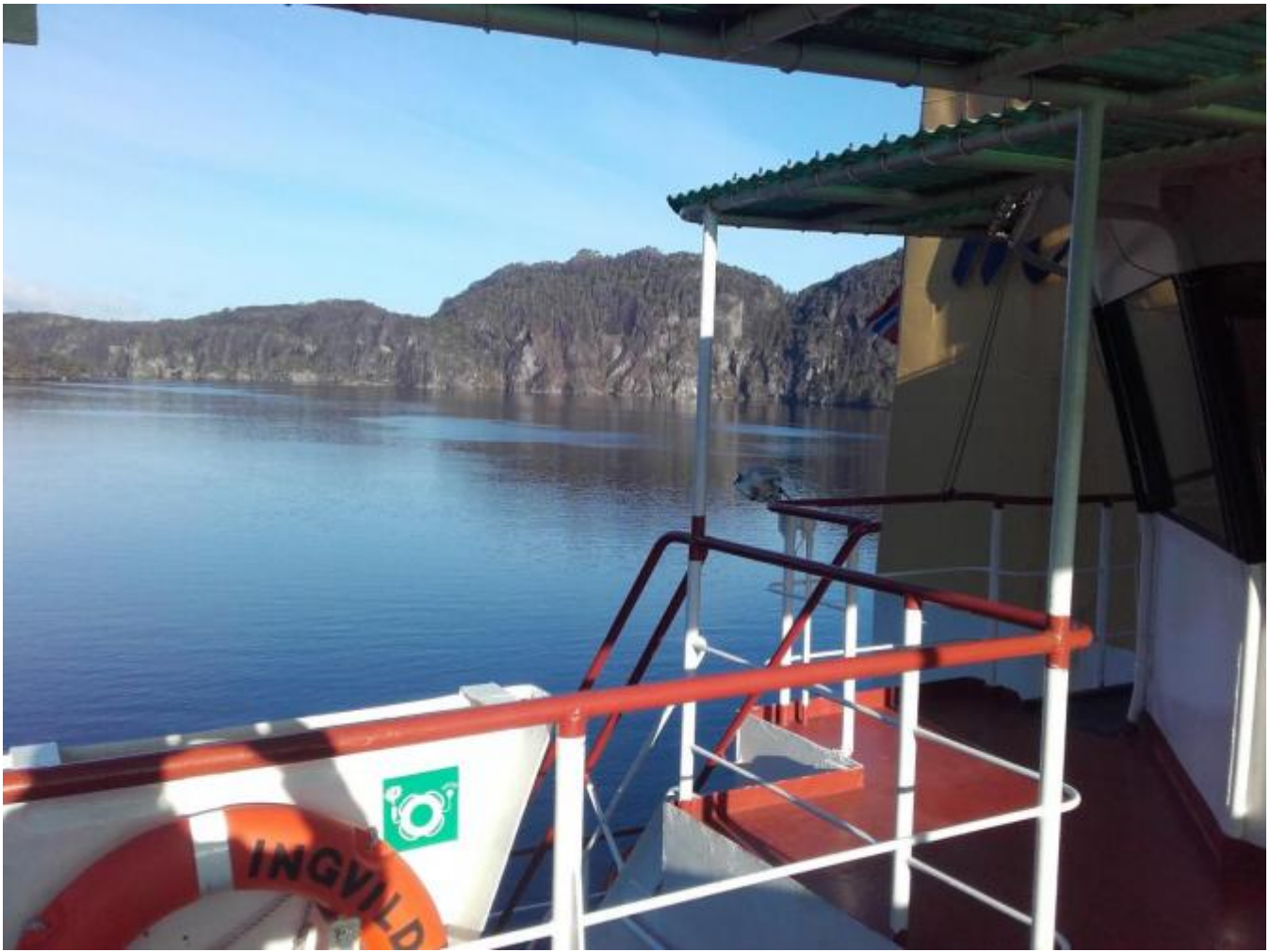
MS INVILD er norsk registrert og fører norsk flagg.