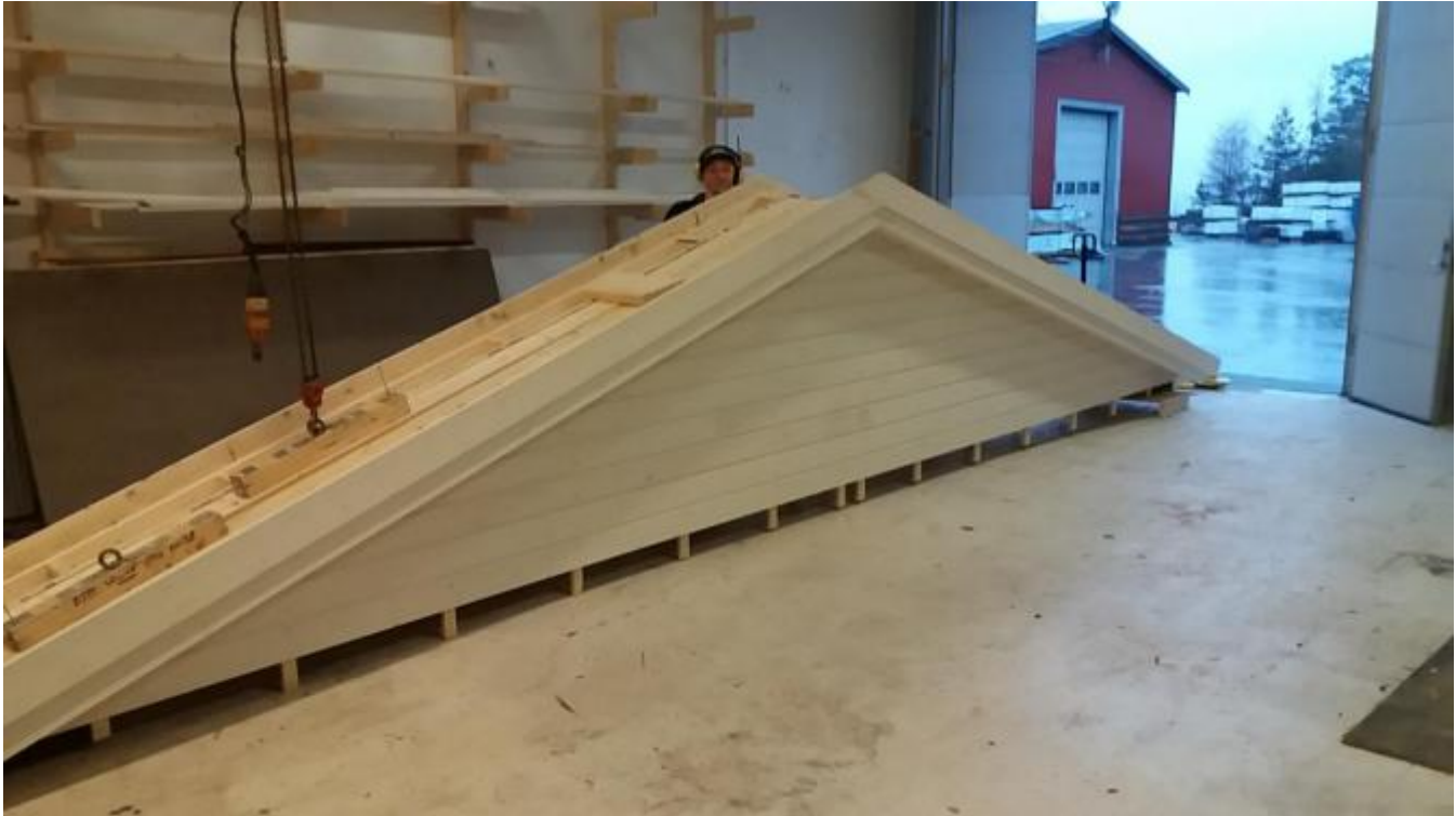
Huset vert produsert i element.

Bygget veil verta ein fin plass for samlingar både for tilreisande og fastbuande.