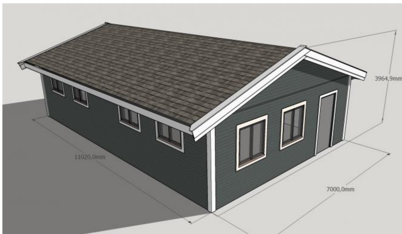
Slik blir det nye samlingshuset til Uskedal båtlag