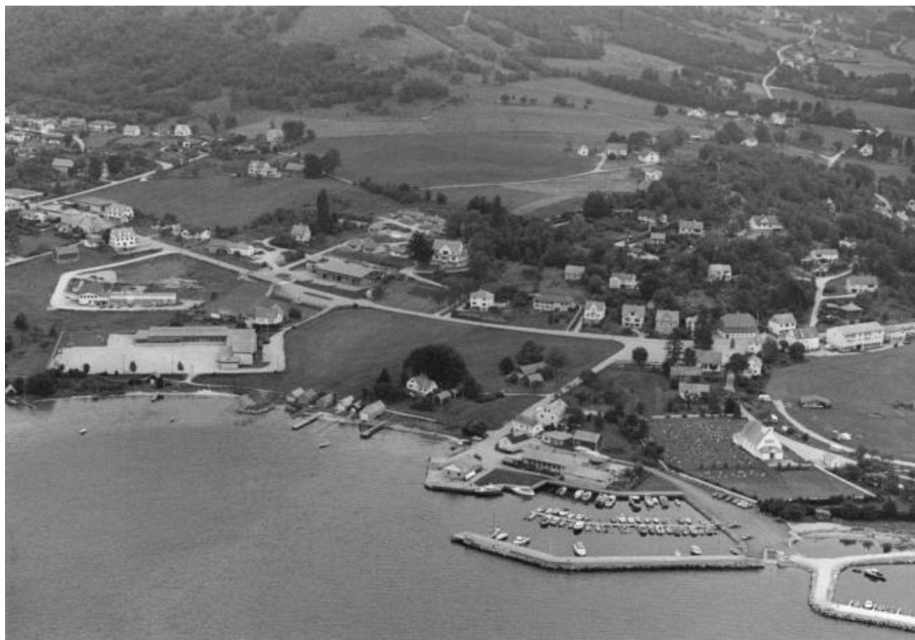
Uskedal sentrum i fugleperspektiv 1991

Kvinnheringen har plukka ut 25 bilete frå Uskedalen for om lag 30 år sidan. Motiva fortel om personar og hendingar på 1980 og 1990 talet,- alt frå Uskedalsdagane til viktige utbyggingstiltak. Dette er ei digital løysing. Berre dei som er tingarar og har avisa på nett, kan sjå bileta.