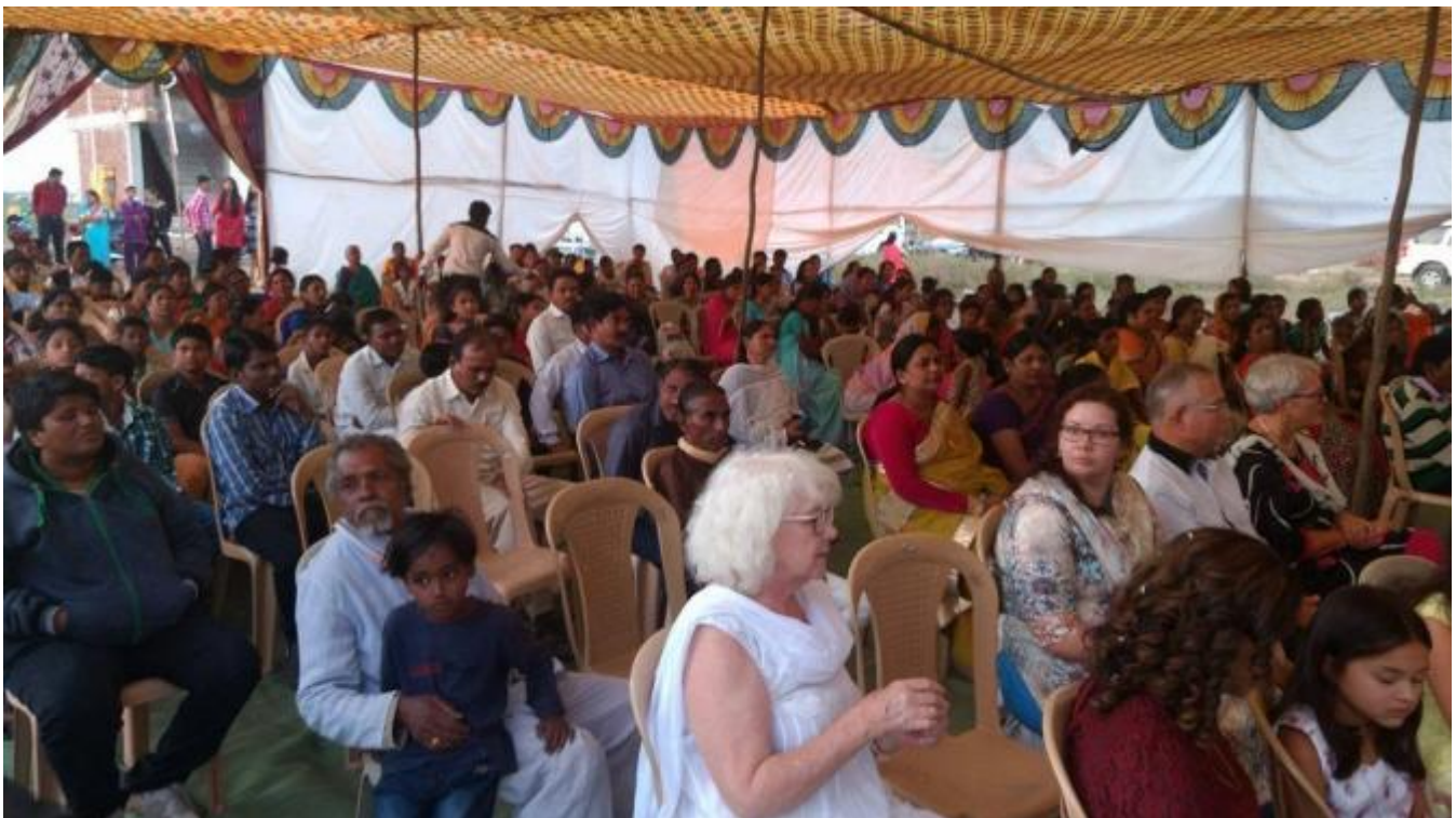
Mykje folk samla under opninga av barneheimen som det var offergåve til under gudstenesta.