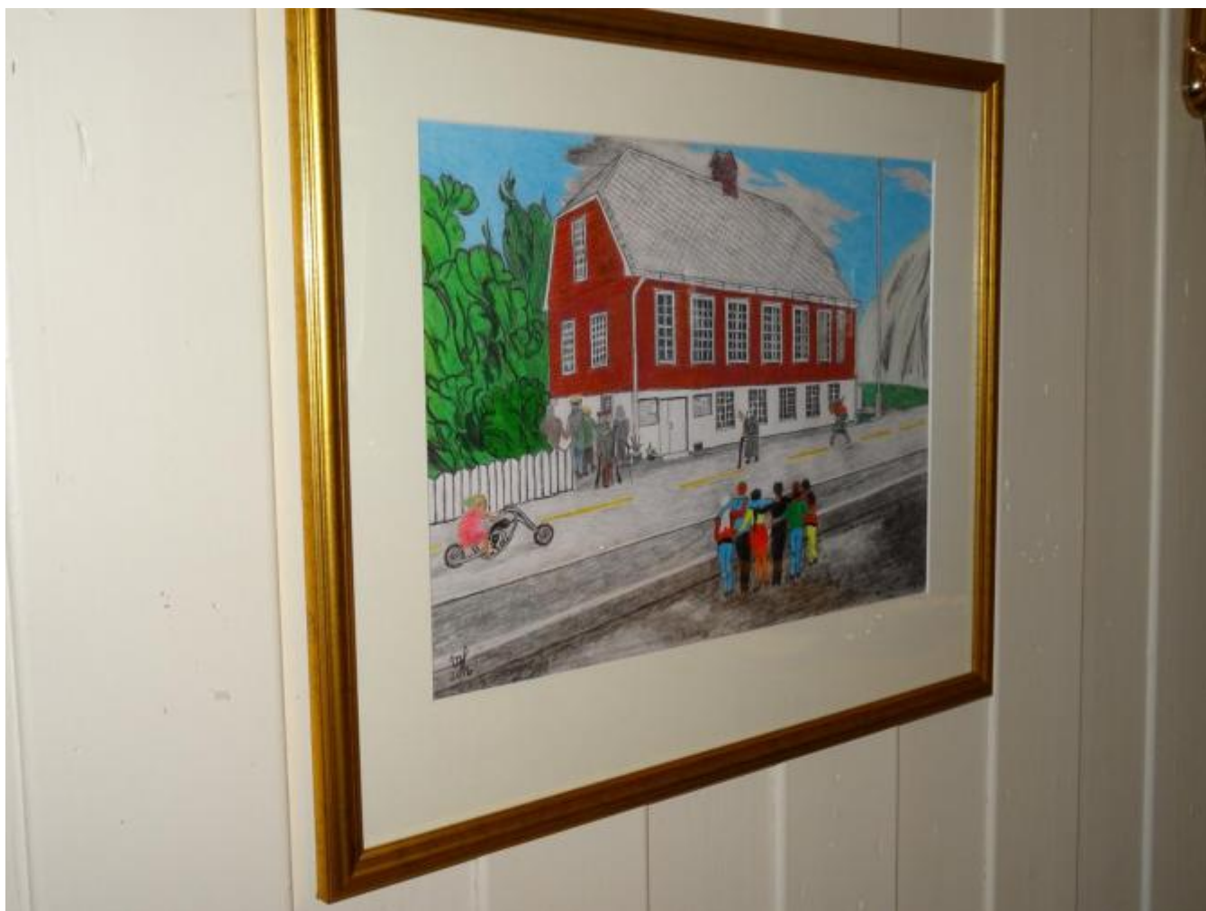
Dette bildet kunne godt hatt tittel Fest i ungdomshuset.

På vårparten hadde Vidar Haugland debututstilling på Galleri Oska. Der presenterte han flotte blyanteikningar med naturmotiv frå nærområdet der dyr gjerne var ein del av motivet. Alle bilda hadde flotte sjølv laga rammer. Utstillinga fekk mykje ros. I samband med Haustfesten hadde Haugland ei ny utstilling i Helgheim.