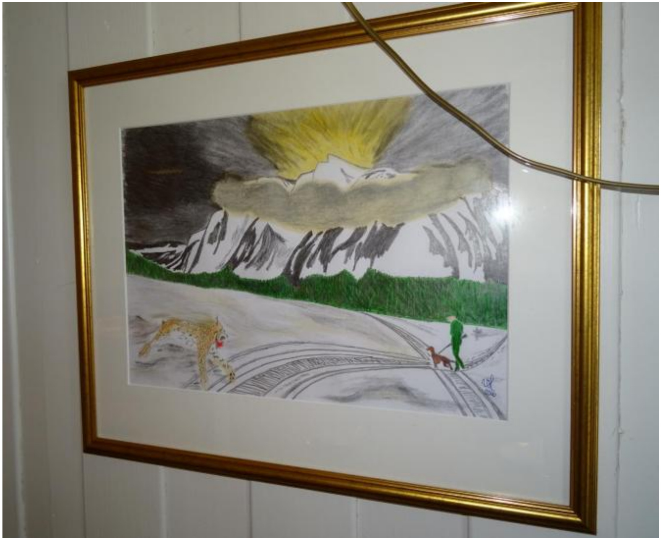
Har gaupa ein plass?