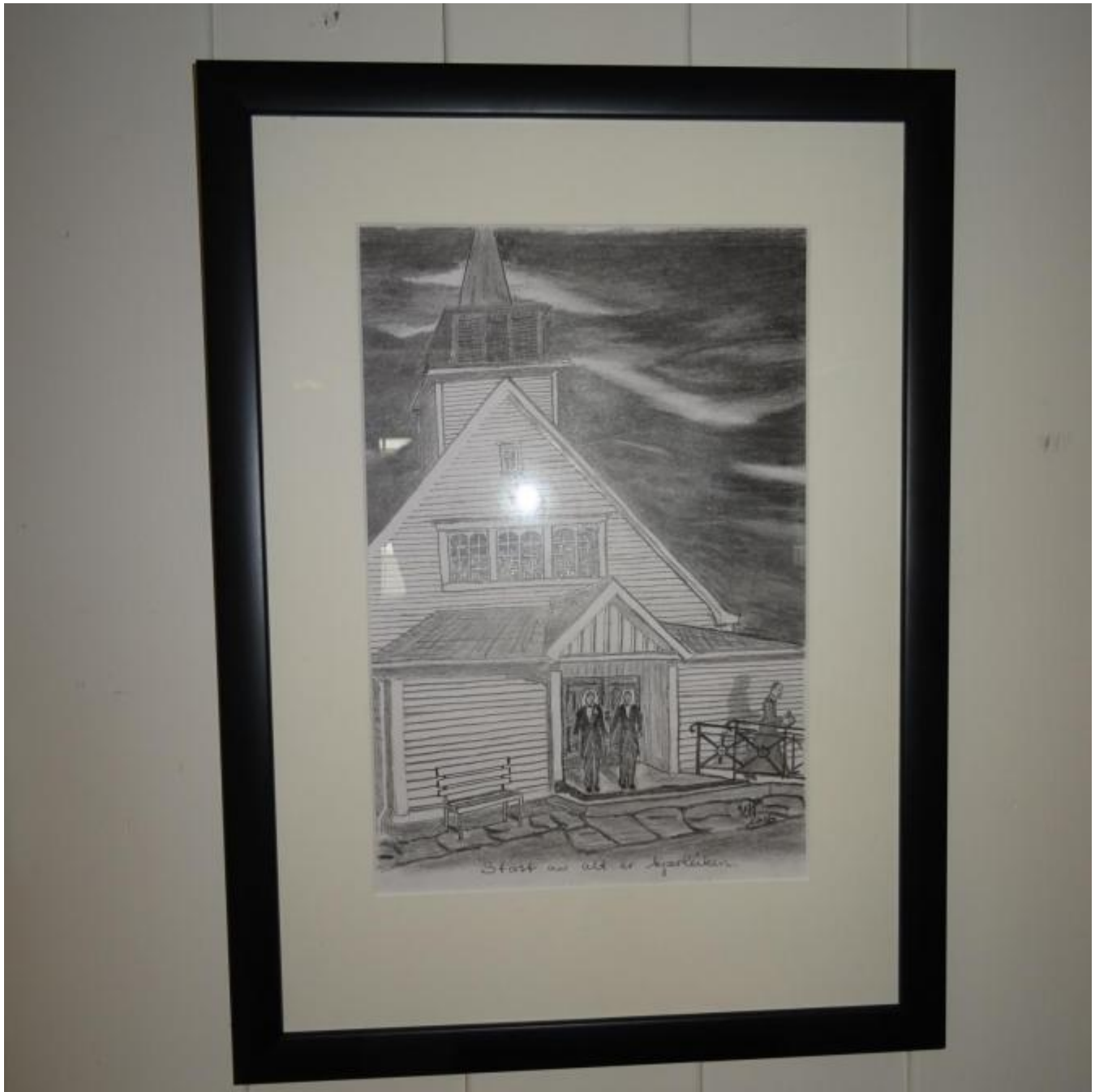
Homofildebatt i kyrkja.