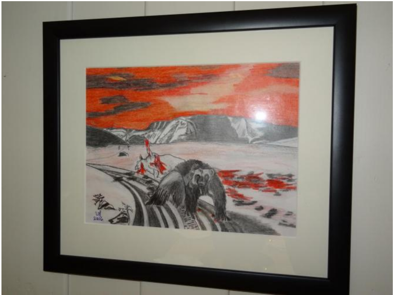
Jerv og husdyr.