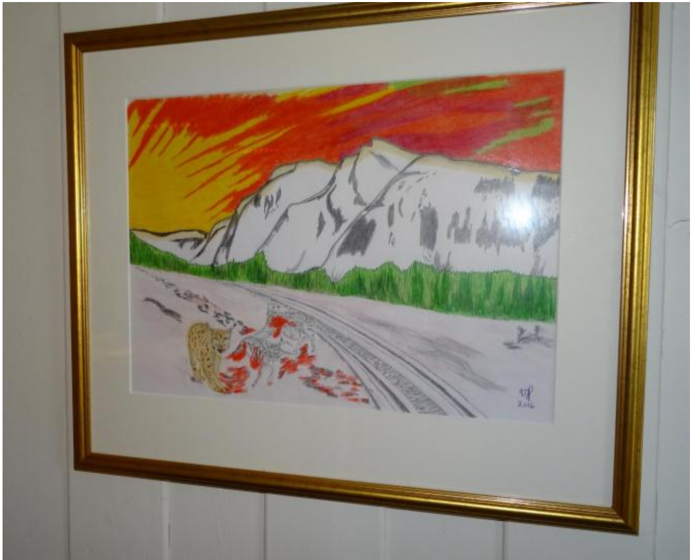
Gaupe og husdyr.