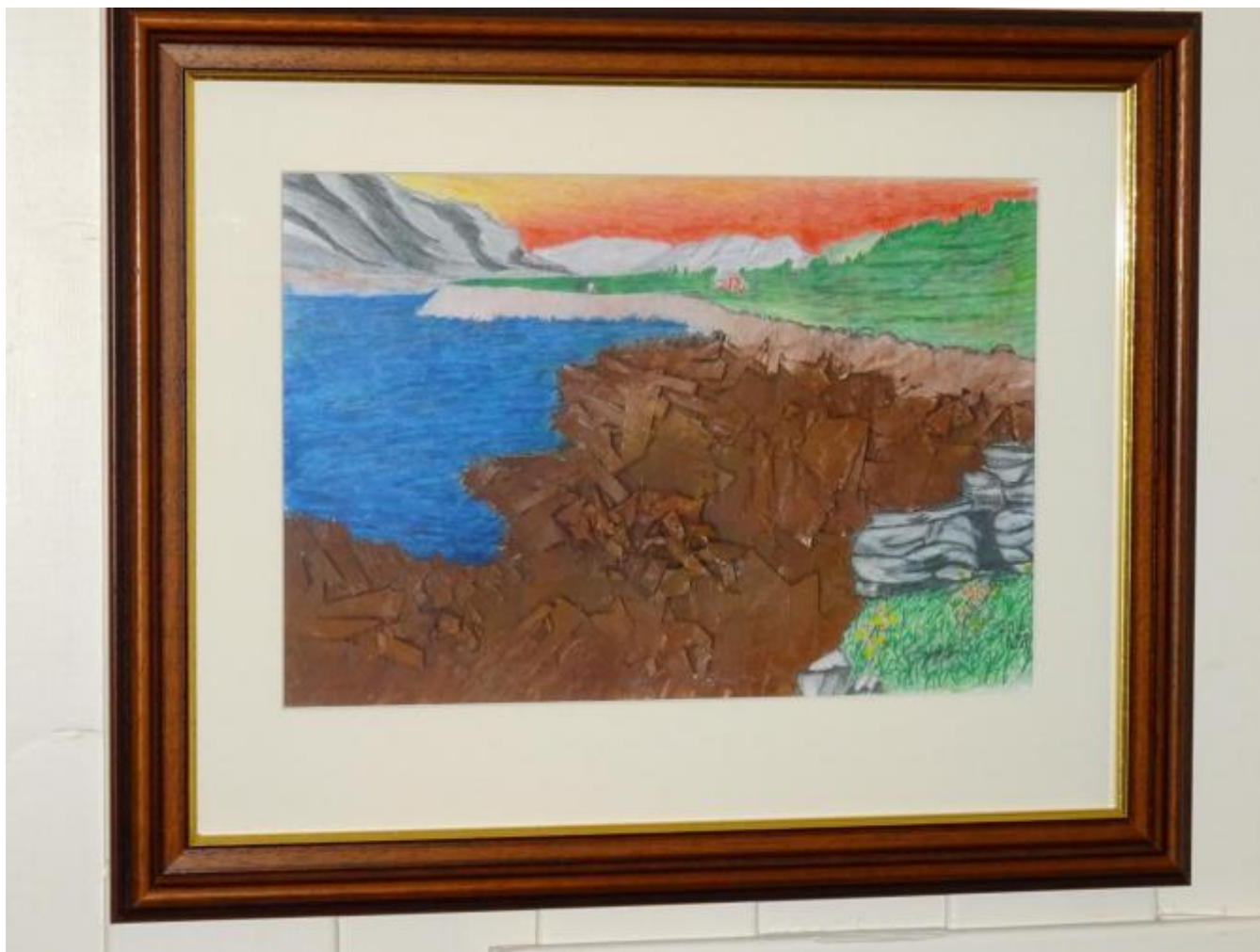
Mannsvatnet og kraftutbygging.

Med utstillinga i Helgheim viste Vidar Haugland kreativitet, stor produktivitet og ikkje minst samfunnsengasjement. Bilda fanga stor interesse hos dei som såg utstillinga, og derfor bad vi Vidar om å senda oss foto av deler av utstillinga.