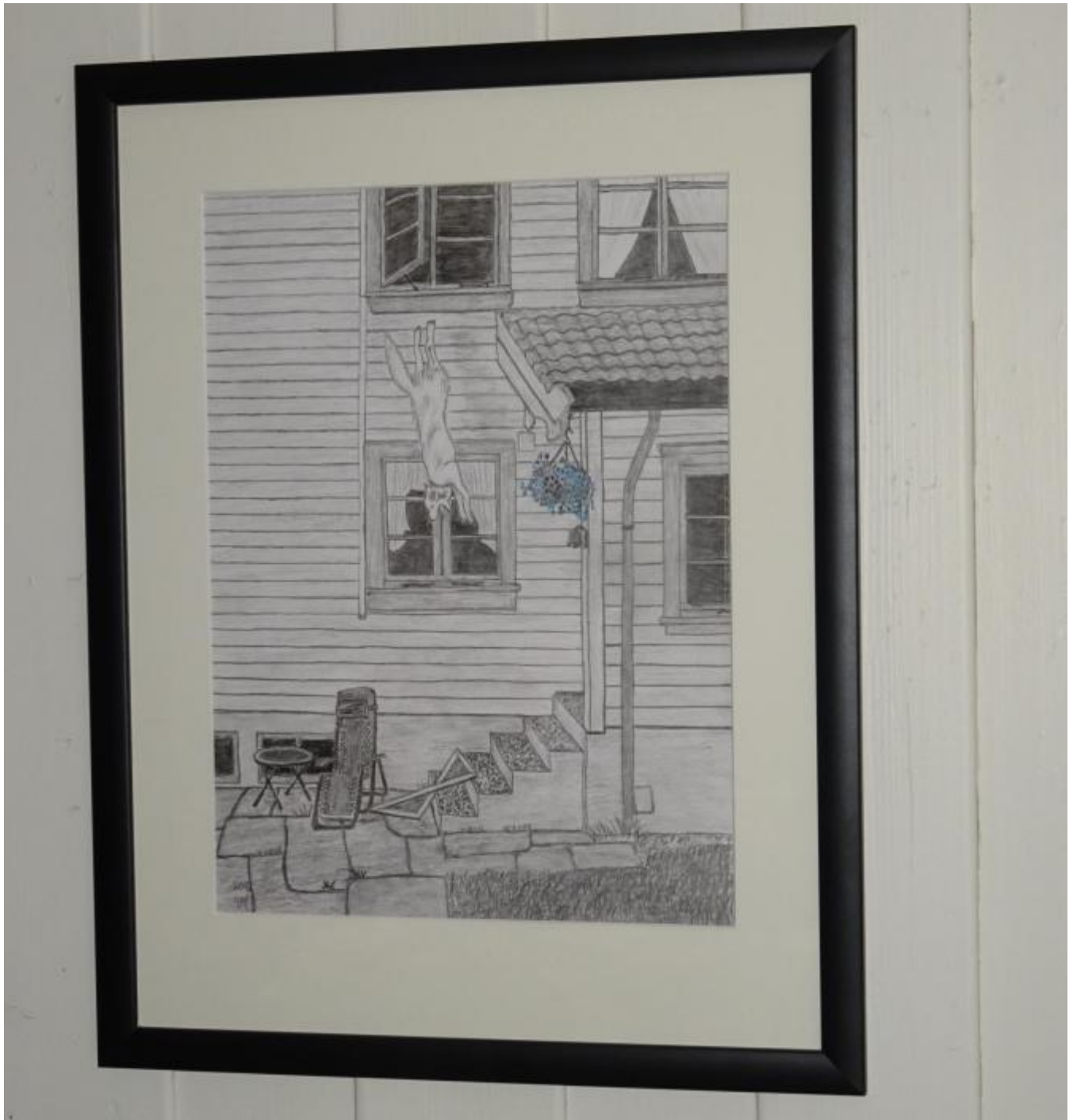
Huskey i lufta.