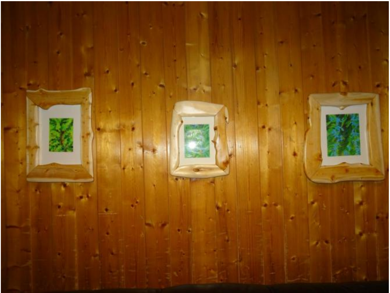
Brakabuskar. Disse bildene var utstilt oppe i gangen medan dei fleste var på veggene i matsalen.