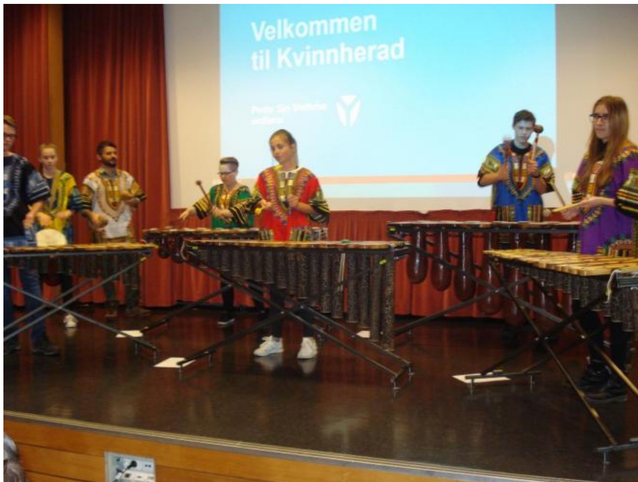
Ungdommane i marimbaorkesteret med flotte velkomstnummer.