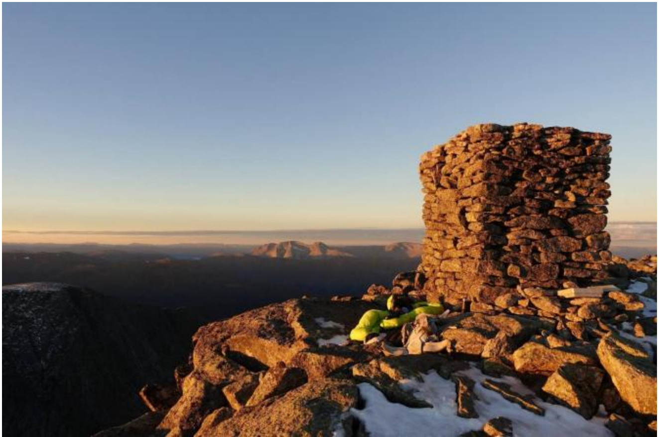
Ved varden var det super sengeplass.