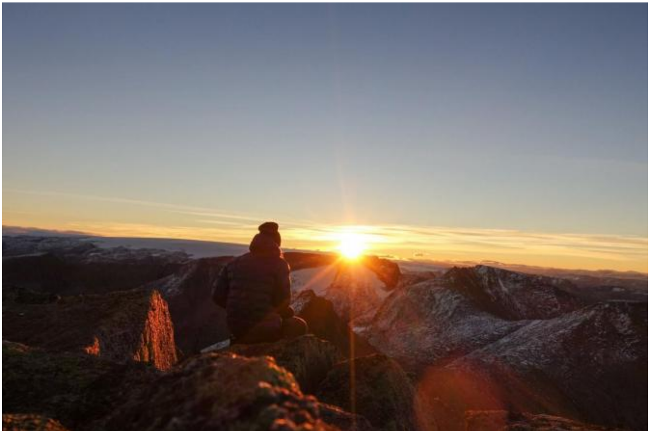
Ein ny dag.

Tekst og nett: Thor Inge Døssland Foto: Vigdis Gammelsæther(Takk for at vi fekk låna dei!)