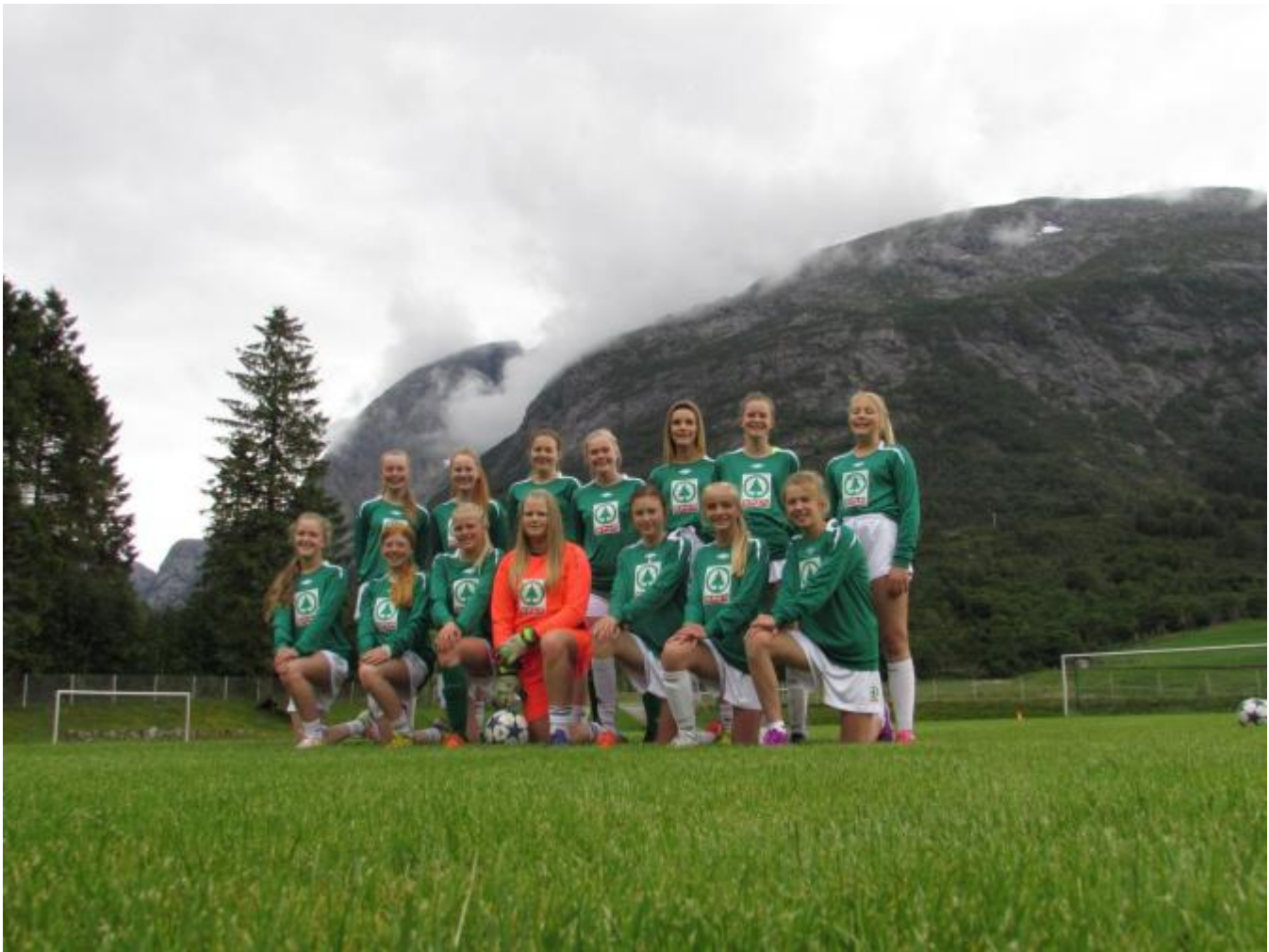
Strålende Norway Cup-innsats!

J14 leverte ein strålende kamp i TV-kampen mot Holmlia i Norway Cup torsdag føremiddag. Etter kjempegod innsats frå heile laget, vart det til slutt ein fortent 3-2 siger. Holmlia var ein god motstandar med eit solid forsvar og ein svært farleg spiss. Vi gratulerer jentene og trenarduoen med den fantastiske innsatsen.