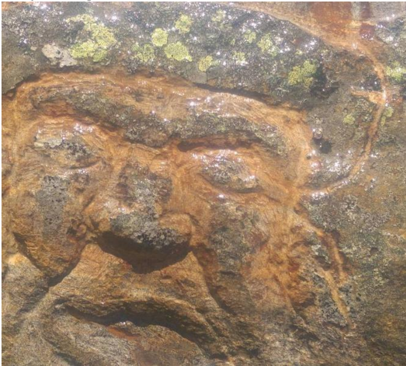
Motivet som kom fram under utgravingane i går og i forgårs.

(SAKA ER OPPDATERT): Uskedalen.no har motteke ei melding om at det kan ha vorte gjort eit sensasjonelt arkeologisk funn under utgravingar her i Uskedalen dei siste dagane. Funnet minner om dei gamle helleristningane, men motivet skil seg frå dei, og det er utforma med ein sterk forhistorisk kunstnarleg dimensjon!