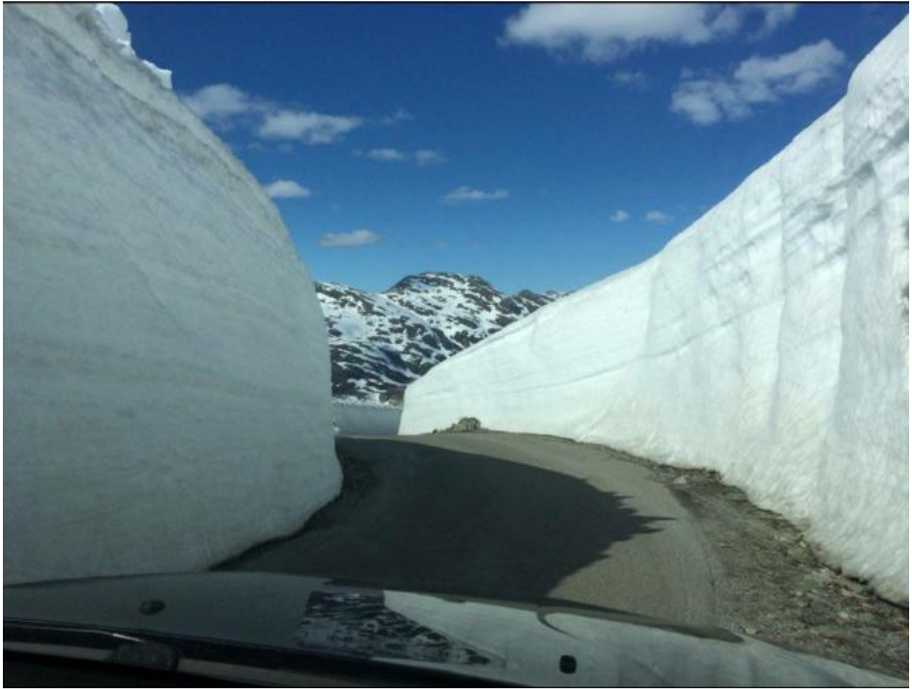
Høge brøytekantar på vegen opp.