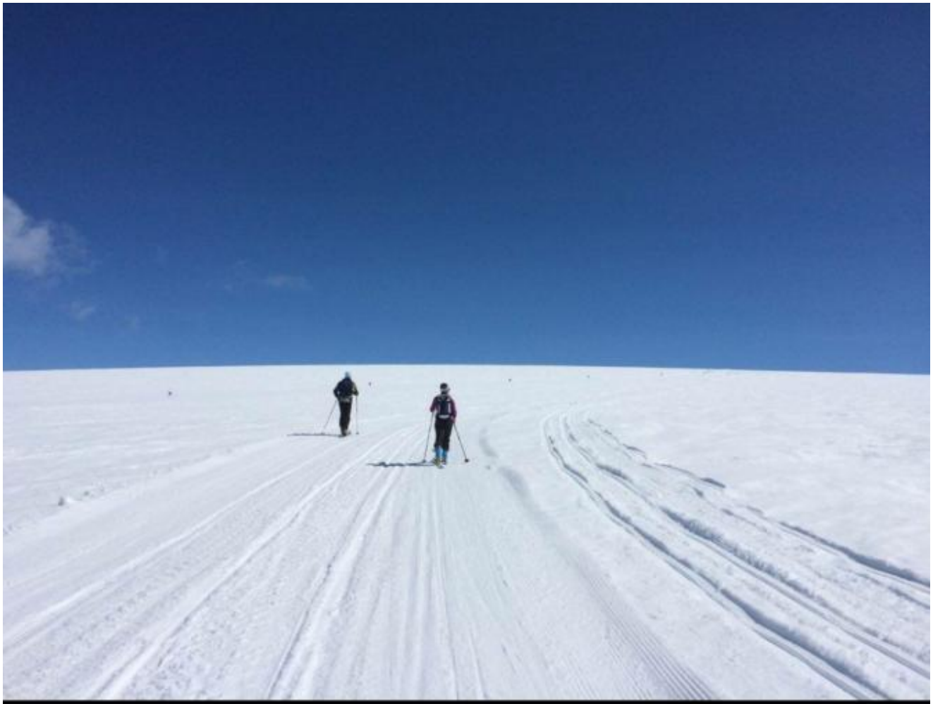
Flott tur på toppen.

Tekst og foto; Saima K. Døssland Nett: Thor Inge Døssland