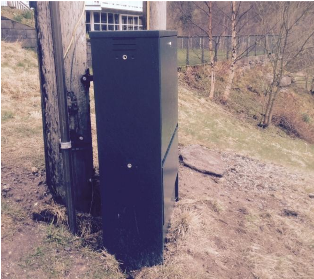
Fiberskap for tilkopling av abonnentar på Musland