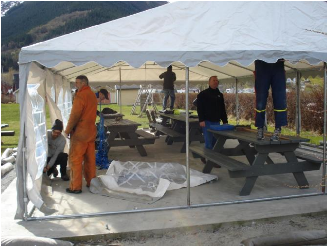
Teltet er oppe.