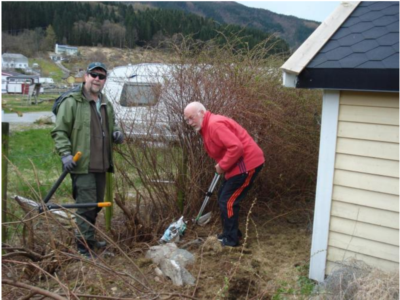
Hekkefjerning med handkraft er slitsomt.