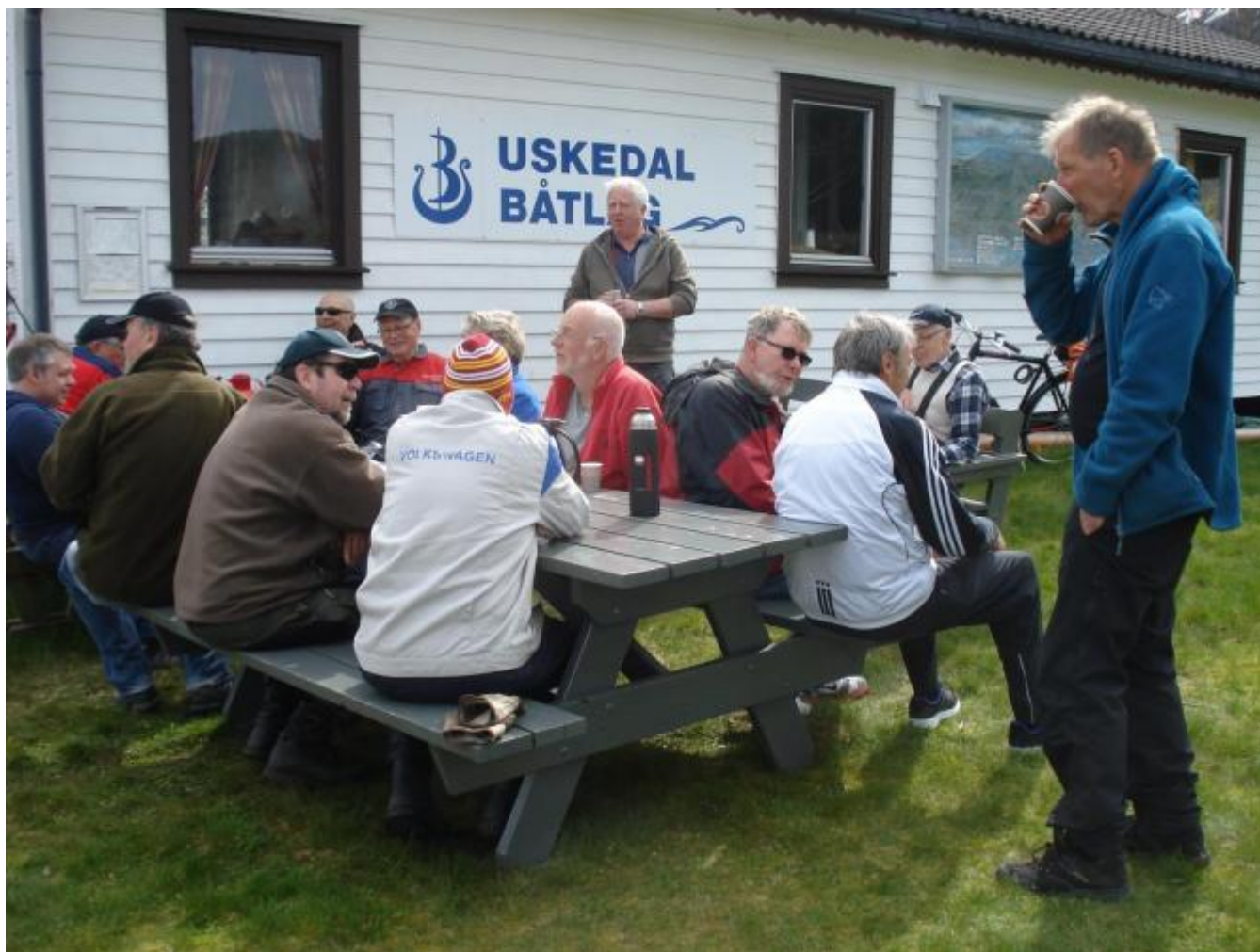
Pause med kaffi og noko å bita i er viktig på dugnader.

I dag vart den store vårdugnaden i båthamna avvikla. 28 av båtlagsmedlemmene møtte opp. Det vart gjort eit storarbeid for at hamneområdet skal vera best mogeleg presentabelt til sommarsesongen. Dei mange arbeidsoppgåvene spreidde seg frå heilt naudsynt vedlikehaldsarbeid til viktige ting for at området skal ta seg fint ut.