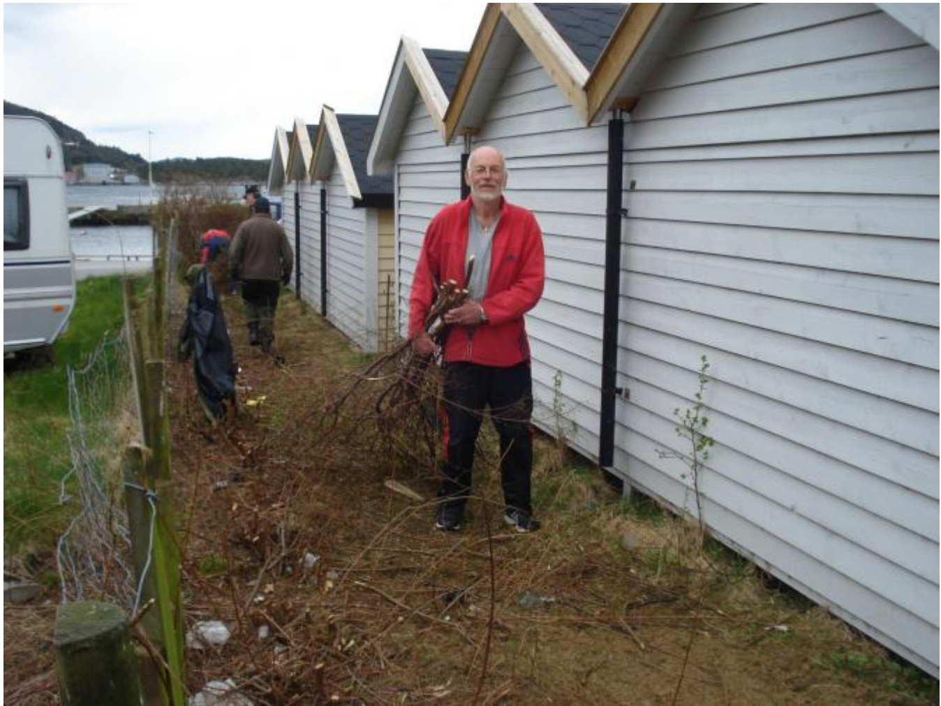
Hekkfjerning med motorsag går unna. då trengst det ryddemannskap.