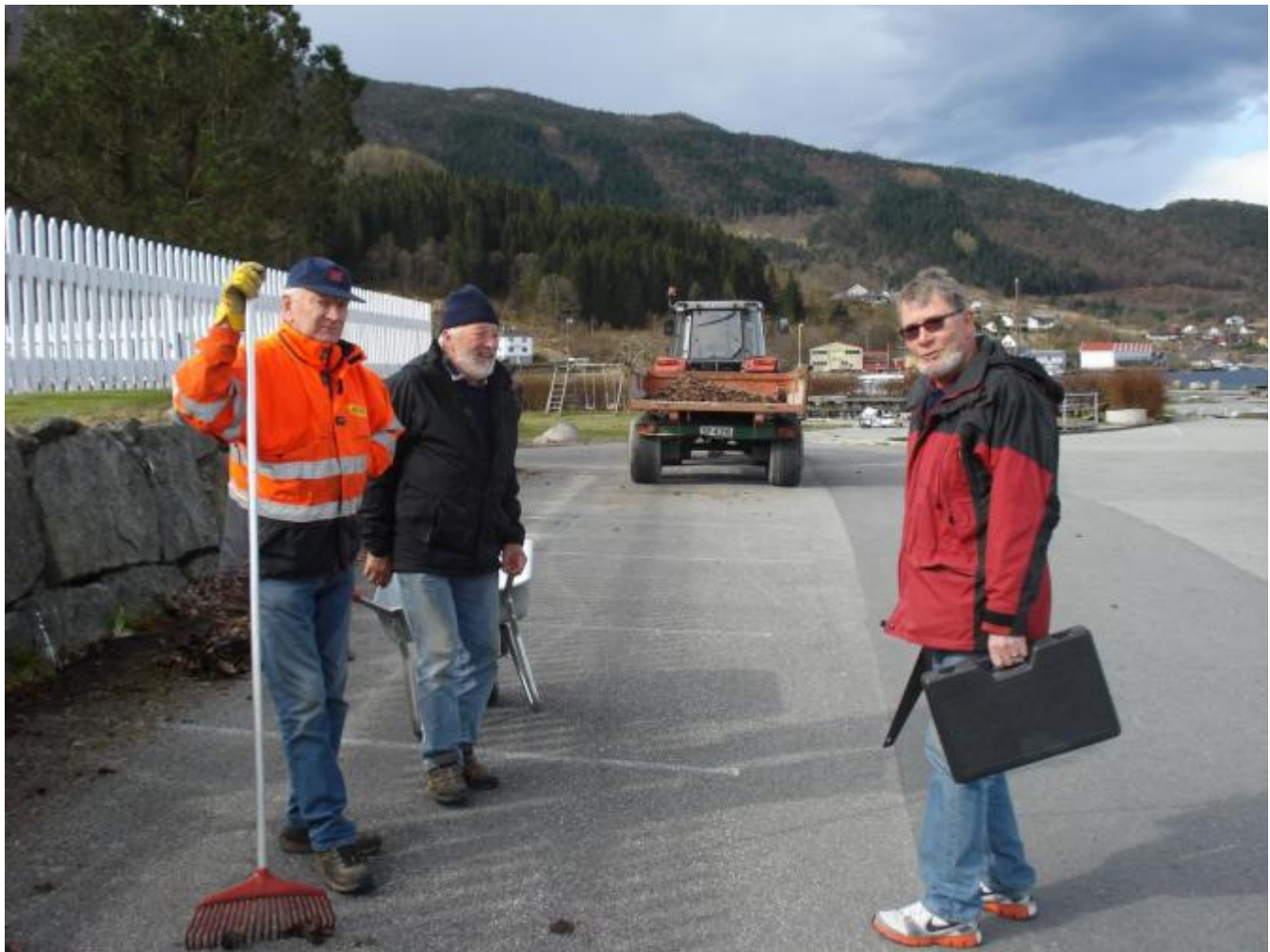
Klar til innsats!

Det er no 113 båt plasser i hamna til Uskedal båtlag.