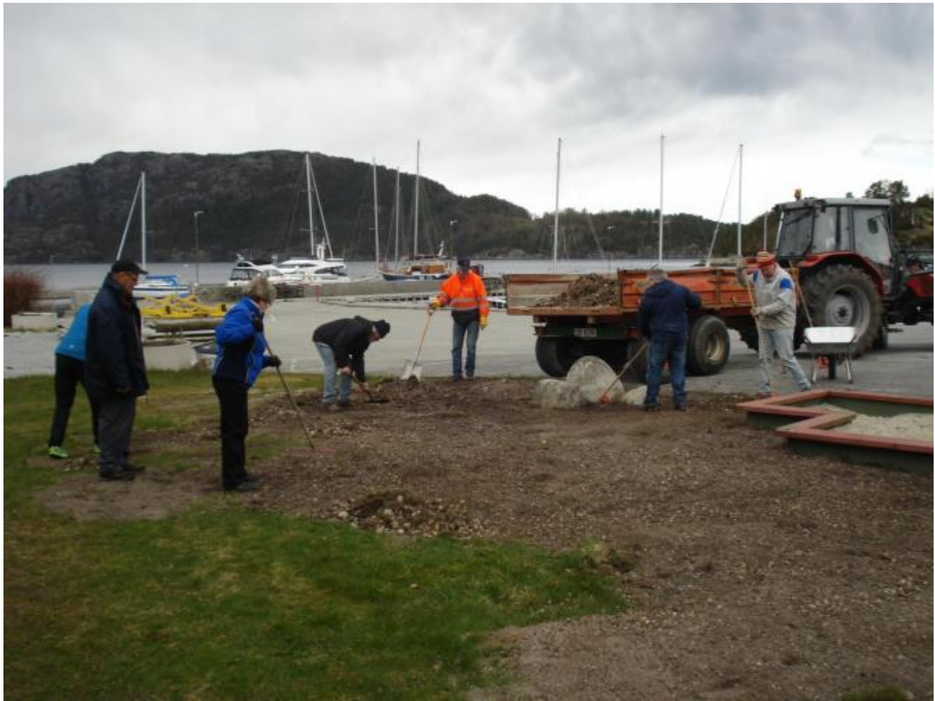
Mange hjelpande hender!