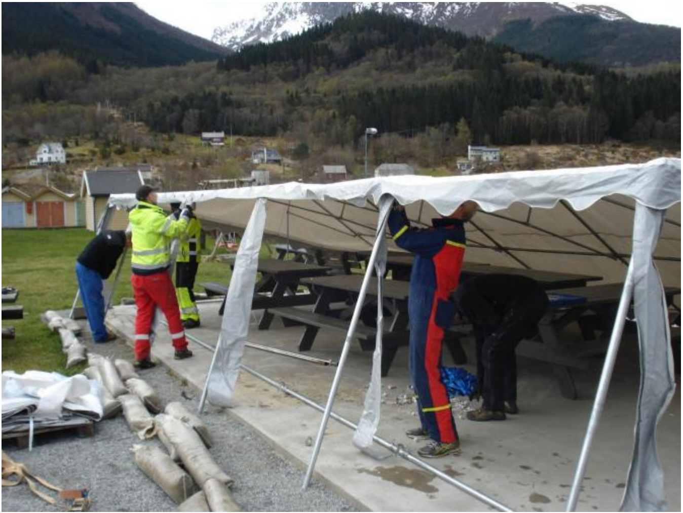
Teltet skal opp!