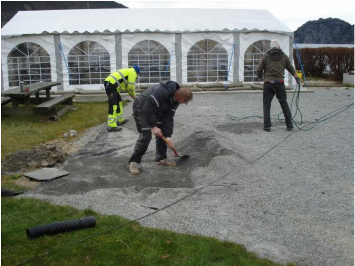
Viktig dreneringsarbeid vart gjort.