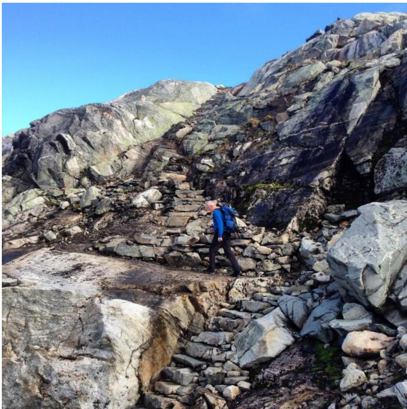
Frå Turistvegen over Folgefonna. Opp mot Breidablikk er det god sti utført av sherpaer frå Nepal i fjor. Denne ruta inngår i Kvinnherad fjelltrim og TellTur

Kvinnherad Turlag har lagt til rette for fjelltrim med klyppepostar på 16 ulike turmål. Vi har delt kommunen inn i åtte ulike område med to turar i kvart av dei. I 2015 deltok 61 personar i fjelltrimmen. Vi la også til rette for digital turregistrering i samarbeid med Friluftsrådet Vest. 18 turmål har eigen kode. 177 personar registrerte turane sine i TellTur i fjor. Vi trur det blir mange fleire i år. Bli med du og!