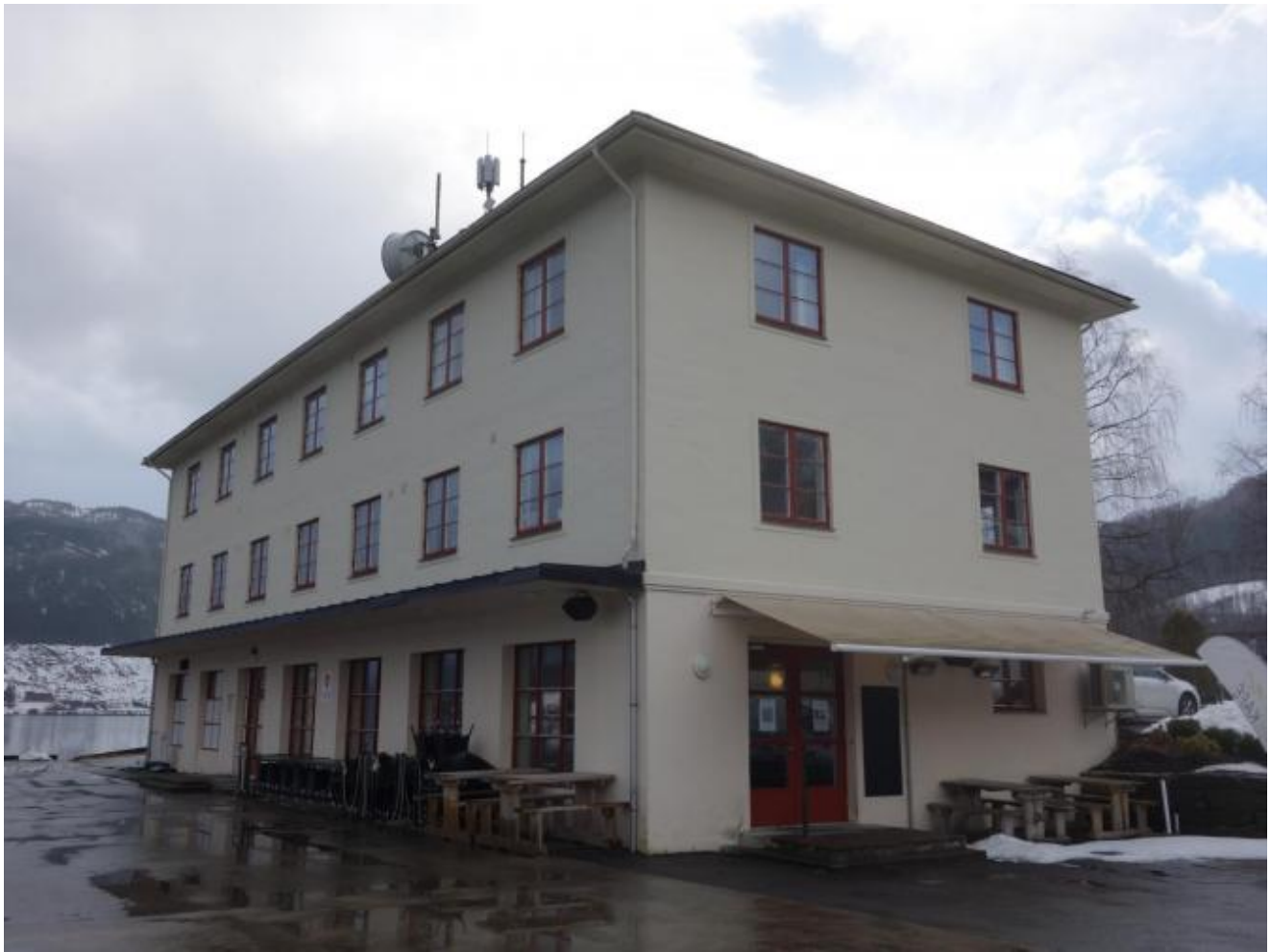
Haugesenteret i Ulvik.

Tekst og nett: Thor Inge Døssland