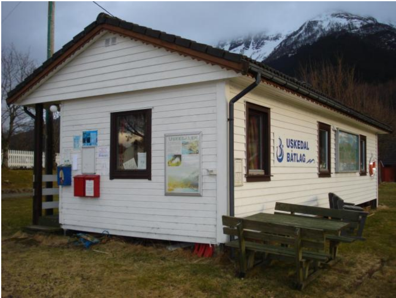
Båtlagshuset er under oppgradering.

Uskedal båtlag er i gang med opprustning av laget sitt hus i båthamna. Dette vert dessverre ikkje klart til sesongstart. Dermed er det godt å ha gode naboar. Båtlaget har nemleg gjort avtale med Rabben Feriesenter om at båtgjester i hamna kan nytta seg av sanitærbygget på ferienesenteret fram til båtlagshuset vert klart.